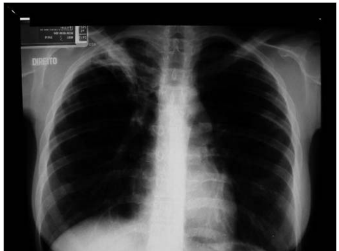
Figura 2. Caso 2. Comprometimento pulmonar assintomático no ápice direito e base esquerda.