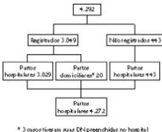
Figura 1 - Nascidos vivos no período de abril a setembro de 1994, residentes em Londrina, segundo situação de registro e local do parto (dados oficiais).

O banco oficial de dados fornecido pelo Serviço Municipal de Saúde referente a essas DN estava distribuído conforme dados da Figura 1.