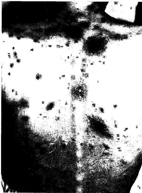
Fig. 5 - Caso 2. Lesões nodulares dolorosas, vinhosas, algumas crostosas - associação com sarcoma de Kaposi.

O envolvimento mucocutâneo na histoplasmose pode ter três apresentações clínicas: 1) infecção primária, acidente laboratorial; 2) foco secundário, histoplasmose disseminada; 3) lesão indiretamente relacionada a