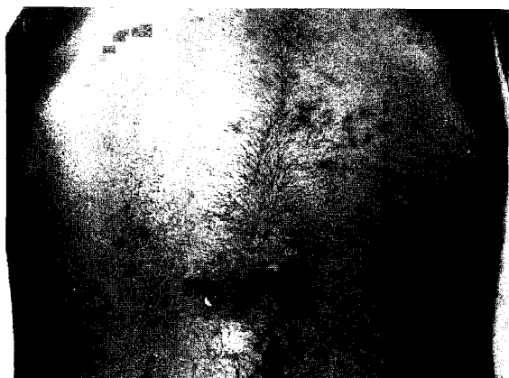
Fig. 3 - Caso 11. Foliculite abdominal.