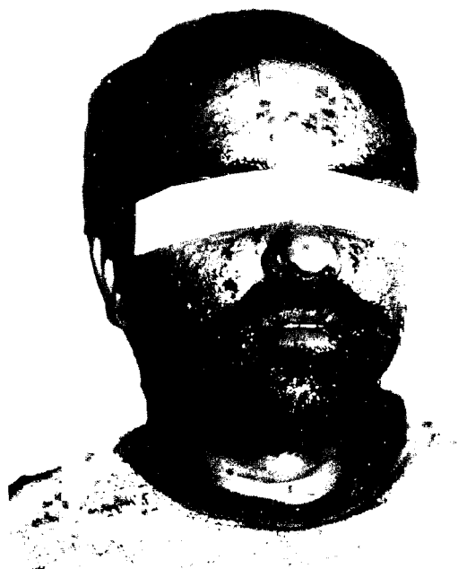
Fig. 1 - Caso 9. Lesões eritemato-papulares da face, com pontos hemorrágicos. Inicialmente confundidas com molusco contagioso.

BS = Bissexual; HS = Homossexual; HP = Heterossexual promíscuo; TS = Transfusão sanguínea; D = Drogadição; NF = Não feito; OF = Orofaringe; GMS = Coloração pela prata; Cult = Cultivo; SNC = Sistema nervoso central; IDh m = Imunodifusão para histoplasmose positiva banda m.