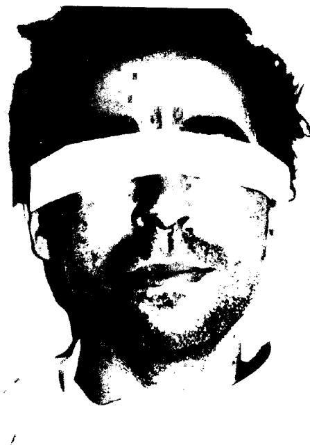
Fig. 2 - Caso 11. Exantema máculo-papular.