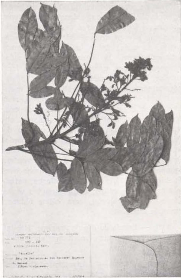
Fig. 2 — Andira pernambucensis , (RB 89272)

1-2mm de diâmetro; estipelas lineares, com 1-1,5mm de comprimento; pecíolo com 4,5-9mm de comprimento; raque com 6-13cm de comprimento; folíolos com 2,7-9cm de comprimento; 1,3-3,4cm de largura, cartáceo-coriáceos, oblongos, ovado-oblongos, glabros, lisos e brilhantes na face superior, opacos e esparsamente piloso na face inferior, base obtusa ou arredondada, ápice curtamente rostrado e mais ou menos retorcido, nervuras delgadas, impressas na face superior e salientes na inferior; peciólulos com 2mm de comprimento. Panículas com até 18cm de comprimento, irregularmente anguladas, ferrugíneas; pedicelos de 1-3mm de comprimento. Cálice adpresso-piloso com 6mm de comprimento, campanulado. Pétalas violáceas (seg. coletor). Estame vexilar livre. Ovário densamente pubescente, com pilosidade adpressa; estilete glabro.