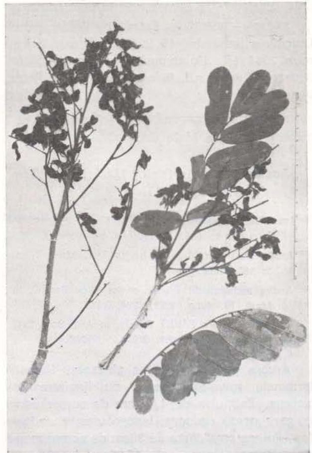
Fig. 3 — Andira handroana , E. Pereira 2064 (Holotypus).

Arbusto. Raminhos com cerca de 4mm de diâmetro, esbranquiçados. Folhas 11-folioladas; pecíolos com até 3-3,8cm de comprimento e 1,5mm de diâmetro, glabros quando adultos; raque com 5-9cm de comprimento; estipelas axilares ou extra-axilares, coriáceas, lineares, de 1-2mm de comprimento; peciólulos de 2-3mm de comprimento, sulcados na face superior; folíolos opostos ou alternos, de 2,8-5,6cm de comprimento e 1,5-2,7cm de lar-