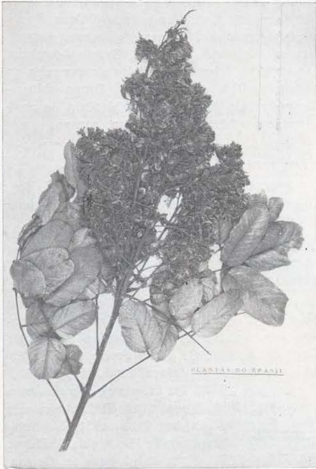
Fig 1 — Andira kuhlmannii (Holotypus).

face superior e subseríceas na inferior, ápice emarginado ou arredondado, base arredondado-subtruncada, margens recurvas; nervuras impressas na face superior e bem salientes na inferior. Panícula densa, com cerca de 20 cm de comprimento; pedúnculos e raque subanguloso-sulcados, pubescentes, com pilosidade ruiva. Flores com estandarte orbicular, emarginado. Cálice escuro, com pêlos seríceos, glabro apenas internamente, 5 — dentado com dentes ovado-triangulares, de 1,5 — 2 mm de comprimento. Estames 10, sendo o vexilar livre e os demais unidos até mais ou menos 2/3 do comprimento do tubo estaminal; anteras oblongas, de 0,8 — 0,9 mm de comprimento. Ovário com 1,4 cm de comprimento, estipitado, ciliado, estilete curvo; estigma simples.