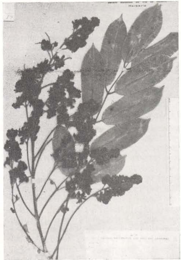
Fig. 4 — Andira macrothyrsa . (A. Ducke 1036).

Árvore com cerca de 40m de altura. Ramos terminais fistulosos, angulosos, estriados, escuros, lenticelados, subglabros. Estípulas ausentes, estípelas muito caducas, pequenas e setáceas. Folhas geralmente com 35-40cm de comprimento; pecíolos e raque estreitamente canaliculados, glabros ou ligeiramente pilosos. Foliolos 9-13, com pecíolo de 7-12mm de comprimento, robustos; lâminas de 5-10cm de comprimento e 2,5-4,5cm de largura, lanceolado-oblongas, cartáceo-membranáceas ou subcoriáceas, pouco brilhantes na face superior e curtamente pilosas na inferior, reticuladas, ápice moderadamente longo-acuminado, base geralmente obtusa, nervura principal mais ou menos plana na face superior e saliente na inferior. Panículas terminais, geralmente com 30-50cm de comprimento, densamente floridas; pedúnculos e raque angulosos, sulcados, cinzento-tomentosos, com ramificações floridas na metade superior de cada raminho; brácteas caducas, pequenas, subuladas e tomentosas. Flores curtamente pediceladas, aromáticas. Cálice na antese com cerca de 4mm de comprimento e 3 mm de largura, subcampanulado, verde-escuro (na planta viva), ligeiramente adpresso-piloso; pilosidade cinzenta, 5-partido no ápice, com dentes desiguais. Pétalas com cerca de 7mm de comprimento, longo-unguiculadas, glabras, brancas, vexilo pintado de par-