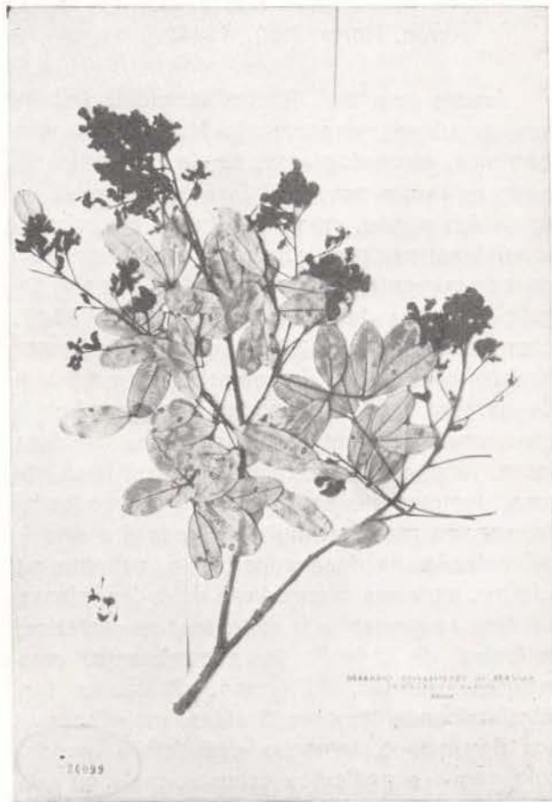
Fig. 5 — Andira marauensis . (Holotypus).

nervura central impressa na face superior, escura e saliente na inferior, nervuras secundárias quase invisíveis. Inflorescências em panículas terminais, com cerca de 10cm de comprimento, multifloras, densifloras; pedúnculo, raque e pedicelos negros ou castanho-escuros, costulados e esparso-pilosos; pedicelos com cerca de 1mm de comprimento. Cálice campanulado, com cerca de 3mm de comprimento, negro, glabro, salvo no ápice, 5-denticulado. Corola glabra e rosada; estandarte com cerca de 7mm de largura, por 7-8mm de comprimento. Estames com 8mm, amarelados (em vivo). Ovário glabro, estipitado; estilete curvo; estigma sub-capitado.