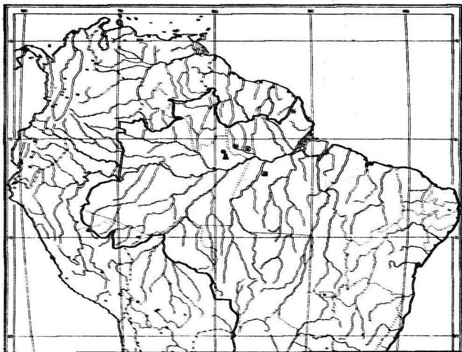
Fig. 2 Distribuição geográfica dos gêneros Paloue e Paloveopsis na Amazônia brasileira: ● Paloue induta Sandw. subsp. glabra W. Rodr. & Lima; ⊙ Paloue riparia Pulle; ■ Paloue brasiliensis Ducke; * Paloue guianensis Aubl.; e ▲ Paloveopsis emarginata Cowan.