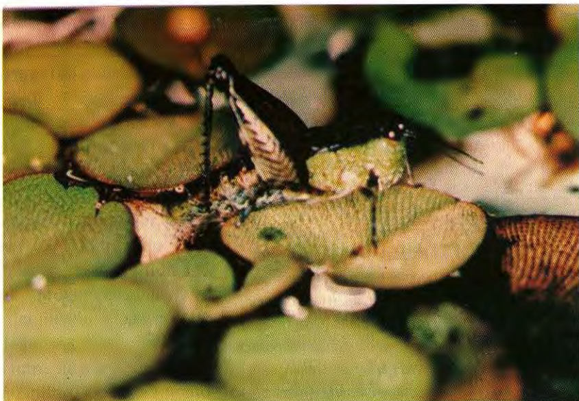
Figura 3. Paulinia acuminata ovipondo sob folhas de Salvinia spp.