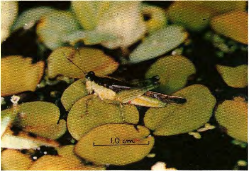
Figura 2. Paulinia acuminata sobre tapete de Salvinia auriculata .