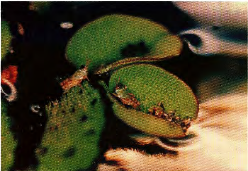
Figura 5. Ninfas de primeiro estágio de Paulinia acuminata .

P. acuminata apresentou seis estádios ninfais em criações ao ar livre. Sands & Kassulke (1986) também observaram seis estádios, utilizando metodologias diferentes, ou seja com temperatura constante de 25 °C.