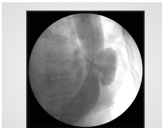
Fig. 2 - Aortografia com úlcera penetrante de aorta torácica descendente.

O hemograma e a bioquímica do sangue eram normais, assim como os marcadores de lesão miocárdica. Os radiogramas de tórax e abdome foram inespecíficos com alguns osteófitos e calcificações parietais da aorta. Os eletrocardiogramas seriados demonstraram ritmo sinusal com alterações difusas e inespecíficas da repolarização ventricular, sem alterações dinâmicas do segmento ST. O ecocardiograma evidenciou disfunção diastólica tipo relaxamento anormal. A ultra-sonografia abdominal total foi normal, excluindo-se a hipótese de urolitíase. A tomografia tóraco-abdominal evidenciou ausência de radiculopatia compressiva e a presença de dilatação aneurismática no terço distal da aorta torácica descen-