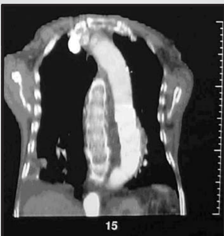
Fig. 4 - Tomografia de tórax de controle após implante do stent de aorta.