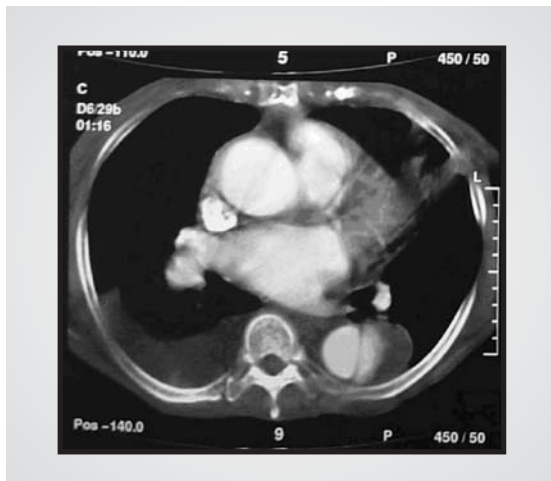
Fig. 1 - Tomografia de tórax, demonstrando uma úlcera penetrante de aorta, uma forma variante da dissecção de aorta clássica.

No seguimento clínico, houve melhora completa dos sintomas com redução dos riscos de complicações hemorrágicas.