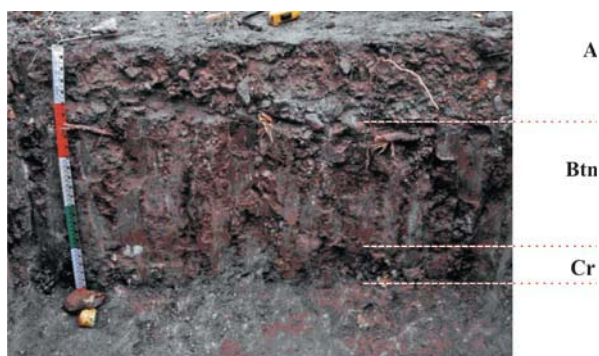
Figura 2. Perfil MJ-1 - Planossolo Nátrico órtico típico, em ambiente moderadamente degradado de Jataúba, PE.

Teores elevados de silte mais areia fina estão associados à maior tendência à formação de crostas superficiais (Roth, 1992; Fox et al., 2004). Estes valores foram significativamente mais elevados nas áreas intensamente degradadas, onde a ocorrência de crostas mais espessas foi significativamente maior, em comparação com os ambientes conservados e moderadamente degradados (Quadro 5).