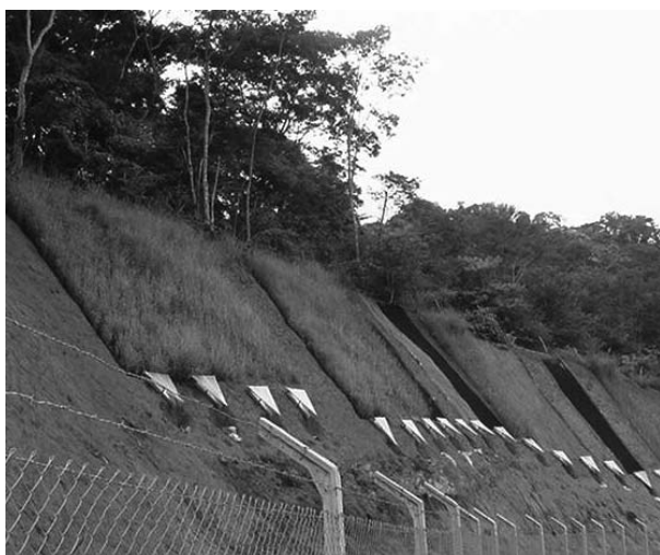
Figura 1. Disposição das parcelas experimentais no talude.