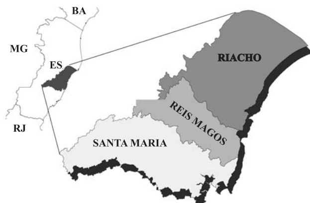
Figura 1. Localização das bacias hidrográficas Riacho, Reis Magos e Santa Maria da Vitória, no Estado do Espírito Santo.

A partir de uma análise conjunta dos mapas de solos e de geologia das três bacias hidrográficas, foram selecionados 56 locais para amostragem, de modo a se obter o maior número de ordens de solos (Quadro 1) e de agrupamentos litológicos representativos do Estado (Figura 2). Para isso, foram utilizados planos de informação, com feições do tipo polígono, obtidos a partir do mapa exploratório dos solos (Embrapa, 1978; IBGE, 2007), mapa geológico (Embrapa, 1978; IEMA, 2007) e o mapa de bacias hidrográficas do Estado do Espírito Santo (IEMA, 2007), todos na escala 1:750.000. Essas informações foram estruturadas em um Sistema de Informações Geográficas (SIG), e os