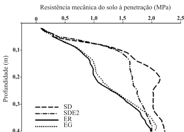
Figura 1. Resistência mecânica do solo à penetração nos diferentes sistemas de preparo do solo. SD: Semeadura direta; SDE2: Semeadura direta com escarificação a cada 2 anos; ER: Escarificação com escarificador munido de rolo destorroador; EG: Escarificação seguida de gradagem.

O efeito da escarificação anual teve reflexos na redução não somente na RP, mas também na