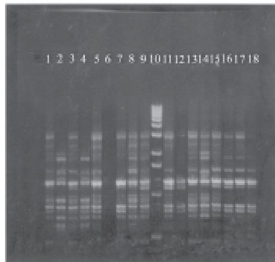
Figura 2. Produtos da amplificação gerados usando o primer 173 nas cultivares Aldrighi (1), Precocinho (2), Capdeboscq (3), Pepita (4), Diamante (5), Riograndense (7), Maciel (8), Jade (9), Turmalina (11), Eldorado (12), Granada (13), Anita (14), BR-1 (15), Coral (16), Chinoca (17), Marfim (18). Prova em branco (6), Marcador 1kb (10).