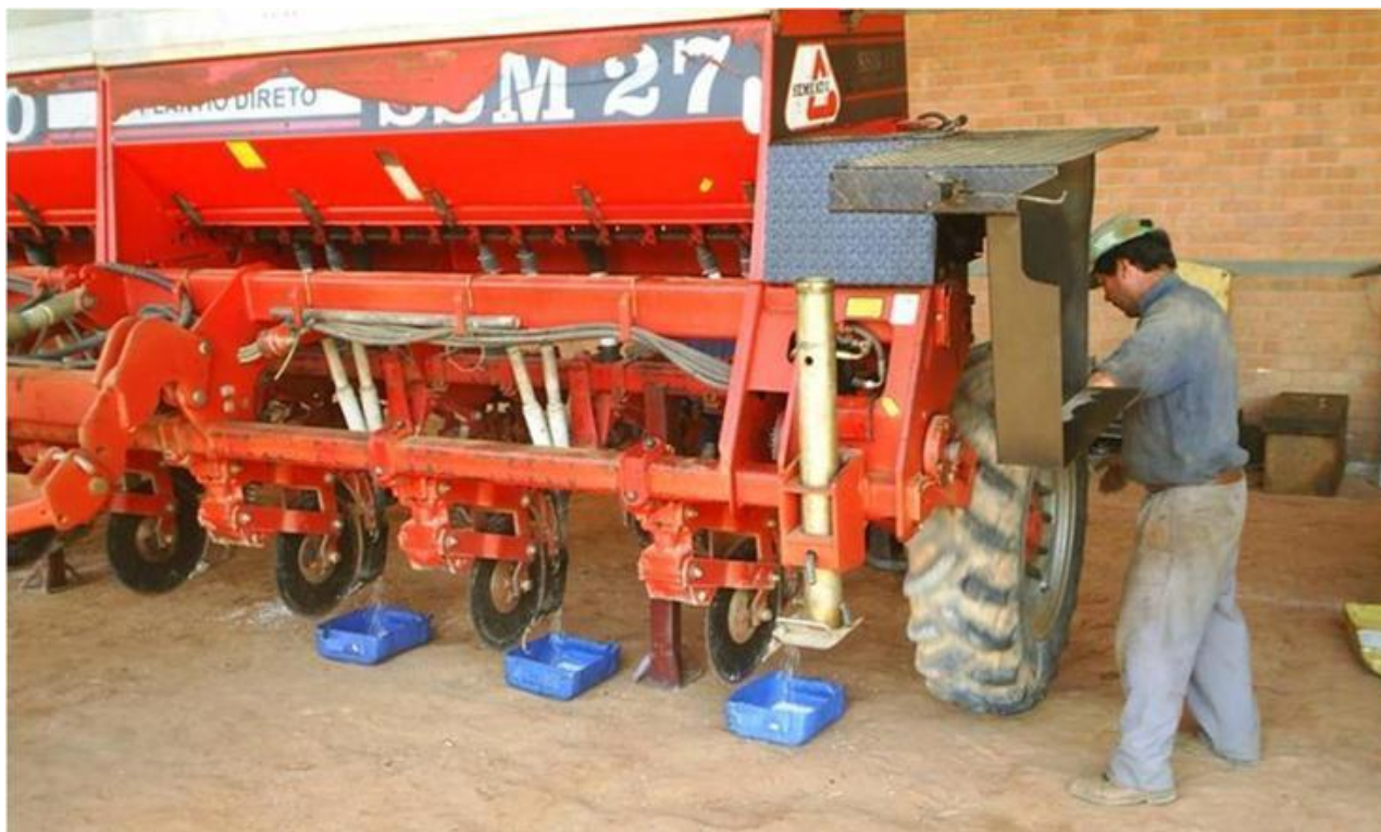
FIGURA 2. Coleta de adubo de semeadora-adubadora para a verificação da variação da dosagem entre linhas. Seeder/ fertilizer spreader sampling to assess the fertilizer dosage variation between rows.

Geralmente, fazia-se a coleta de adubo quando a equipe responsável declarava que a semeadora-adubadora podia iniciar a semeadura do milho. Considerou-se como aceitável a variação de 10%. Quando os valores eram maiores, trabalhava-se nas linhas com valores extremos para reduzir a referida variação e repetia-se o processo de coleta quantas vezes o proprietário ou o tempo que antecedia a semeadura permitia (Tabela 1).