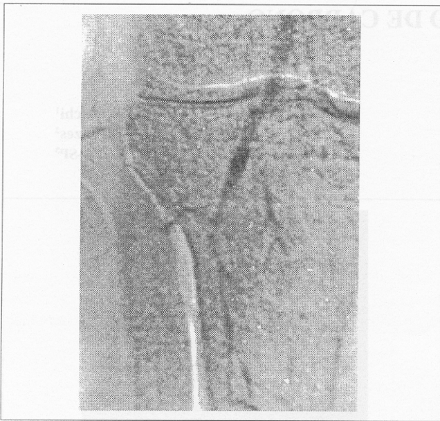
Figura 2 – Arteriografia com CO 2 e contraste iodado não tônico. Artéria poplíteia e colaterais. Nota-se aqui um melhor padrão de imagem com a adição de contraste

em estudo, com o paciente em posição de Trendelenburg. As imagens foram obtidas com intensificador em arco portátil e subtração digital. O paciente foi submetido a restauração arterial, ponte fêmoro-poplíteia com veia safena, dois dias após o exame, com sucesso. Não houve complicações inerentes ao procedimento de diagnóstico utilizando o CO 2 e a função renal permaneceu inalterada.