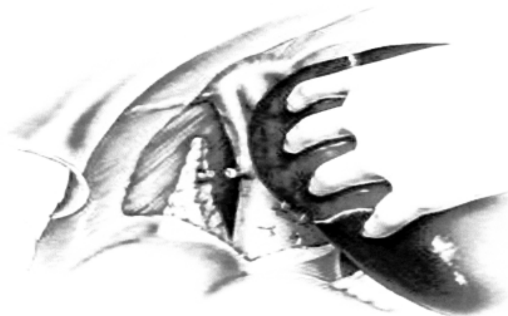
Figura 1 - Via de acesso hepática direita com reflexão do fígado para a esquerda.

Em 1992 Yamamoto et al. 4 descreveram o caso de um paciente com hepatocarcinoma localizado no segmento I, com dimensão de 3x3 cm, em que foi realizada ressecção isolada após divisão da porção anterior do fígado para permitir a abordagem do lobo caudado. A hepatotomia do parênquima que recobre o segmento I, está associada com grande perda sanguínea além de dano hepático importante e totalmente desnecessário. O acesso direito com