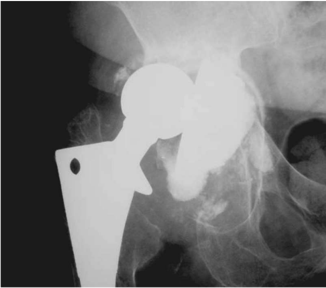
Figura 2 – Radiografia anteroposterior do afrouxamento acetabular, deficiência tipo IV segundo D'Antonio et al. 1