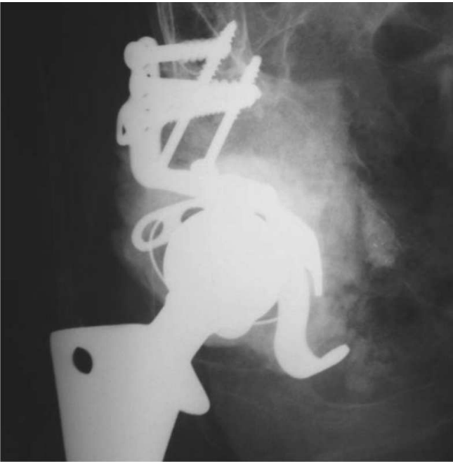
Figura 3 – Radiografia no pós-operatório imediato mostrando a reconstrução acetabular com enxerto bovino liofilizado e dispositivo de reforço.

são restaurar o estoque ósseo, reparar a mecânica do quadril e obter estabilidade, e o uso de enxerto ósseo é imperativo para alcançá-los. Autoenxertos são excelentes, mas sua quantidade geralmente é limitada, e assim os aloenxertos têm sido frequentemente utilizados. Portanto, um banco de ossos sob estrito controle de qualidade é necessário para minimizar o risco de transmissão de doença. Entretanto, não há uma técnica única que forneça uma solução para todas as deficiências. A reconstrução com osso esponjoso picado impactado tem dado bons resultados 2,12 , mas há certo ceticismo a respeito de seu uso em acetábulo com complicações, especialmente aqueles nas deficiências