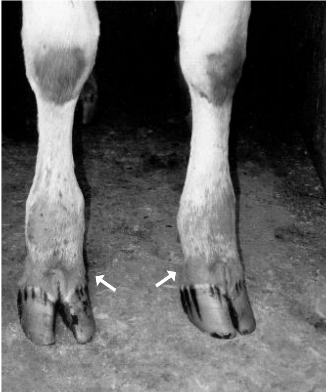
Fig. 8. Hiperemia e alopecia da extremidade distal dos membros anteriores (Bovino 181), na intoxicação experimental pelas favas de Stryphnodendron obovatum .

dade da urina dos bovinos por eles estudados esteve diminuída.