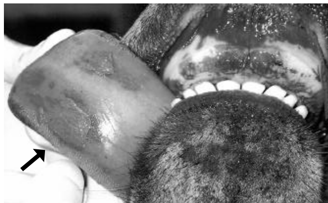
Fig. 6. Congestão e erosões/úlceras na face ventral da língua, algumas cobertas por material necrótico amarelado e deposição de pigmento castanho-amarelado no pulvino dental (Bovino 181A), na intoxicação experimental pelas favas de Stryphnodendron obovatum .