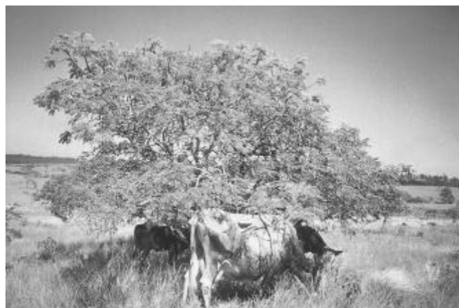
Fig. 3. Bovinos se alimentando das favas de Stryphnodendron obovatum ; região de Cerrado, Botucatu, SP.