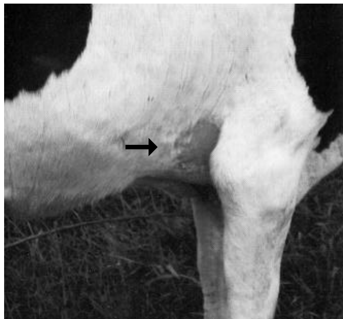
Fig. 7. Hiperemia e alopecia da região axilar (Bovino 181A), na intoxicação experimental pelas favas de Stryphnodendron obovatum .