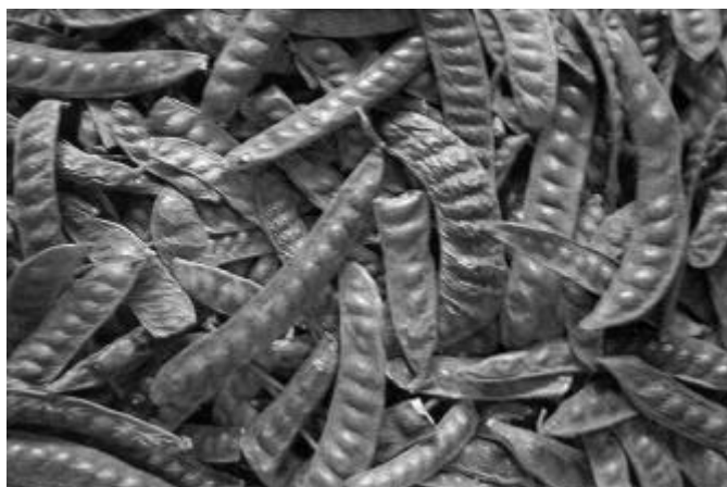
Fig. 2. Favas maduras de Stryphnodendron obovatum .