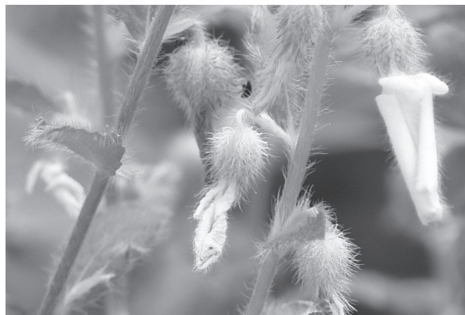
Fig.5. Hybanthus ipecaconha .

Hybanthus ipecaconha (papaconha) (Fig.5). Foi citada por três entrevistados como tóxica. O período de intoxicação é de abril a começo de junho. Os sinais clínicos mencionados foram diarreia, perda de equilíbrio, abortamento e morte de caprinos e bovinos.