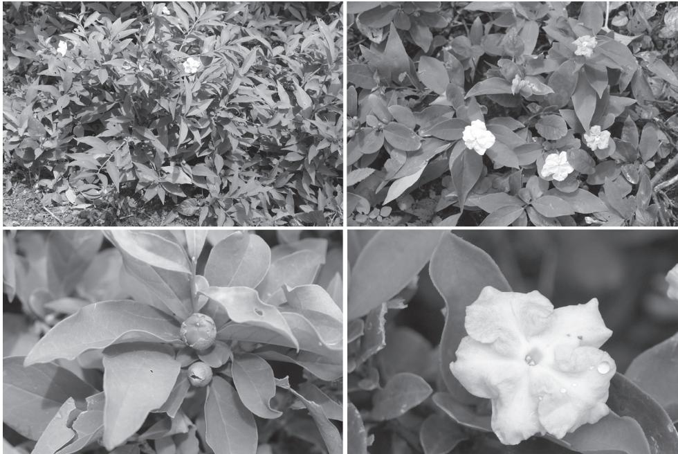
Fig.3. Brunfelsia sp.

como único sinal clínico a perda de peso. Os sinais clínicos relatados por outros entrevistados foram diarreia, focinho seco, fraqueza, perda de peso, nascimento de animais fracos e abortamento. Alguns animais morrem. Cinquenta casos de aborto teriam ocorrido em um rebanho de 350 caprinos e 12 bovinos teriam abortado no terço final da gestação. Um entrevistado relatou ainda a morte de oito caprinos num rebanho de 100 animais na década de 80.