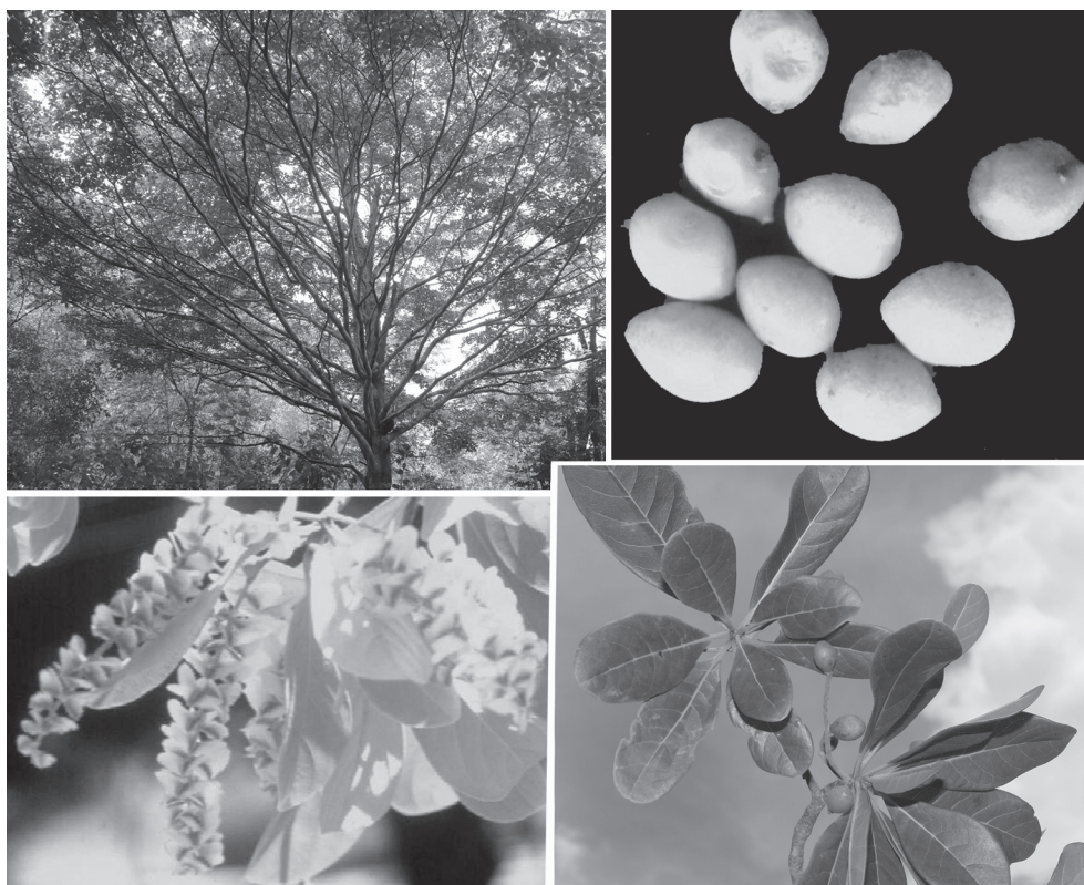
Fig.2. Buchenavia tomentosa .

Buchenavia tomentosa (mirindiba, birindiba) (Fig.2). A planta foi citada como tóxica para caprinos, ovinos e bovinos por vinte entrevistados, sendo a responsável pelo maior número de abortamentos mencionado no presente estudo. De acordo com os entrevistados os animais se alimentam avidamente dos frutos que caem de agosto a outubro. Um produtor relatou que a quantidade de frutos varia a cada ano; se em um ano a planta produz mais, no ano seguinte a produção é menor. Outro entrevistado relatou um surto em um rebanho de 160 bovinos em agosto de 2007 e descreveu