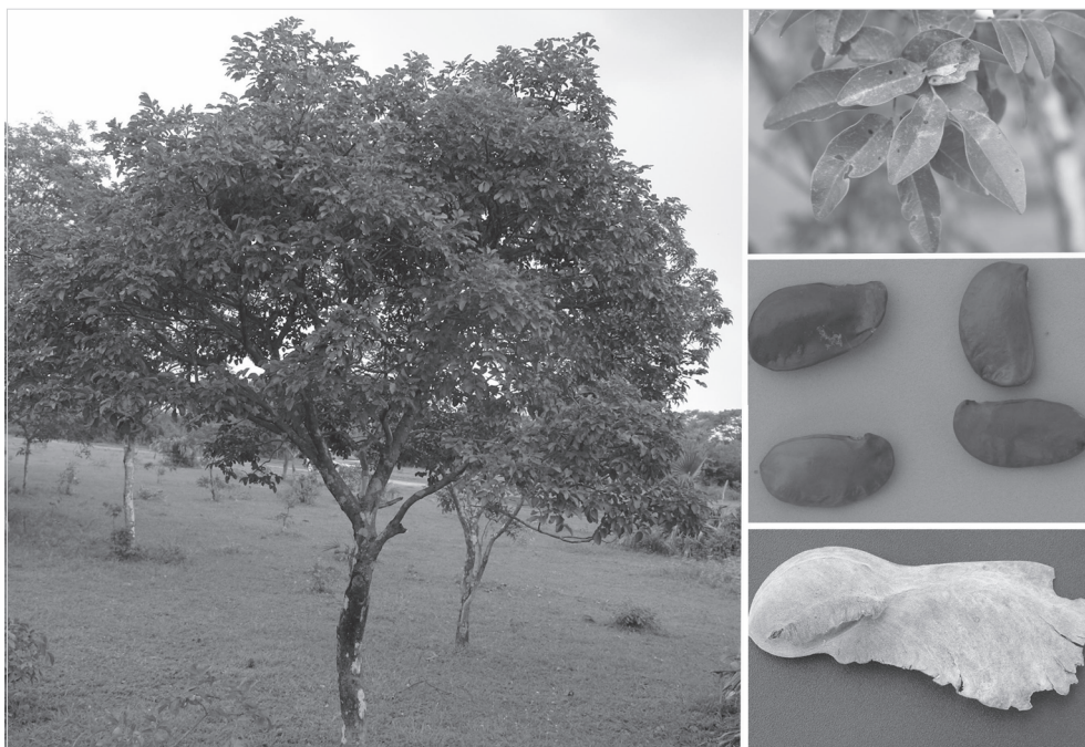
Fig.4. Luetzelburgia sp.

Brunfelsia sp. (manacá) (Fig.3). Dezoito entrevistados conhecem a planta como tóxica. As intoxicações ocor-