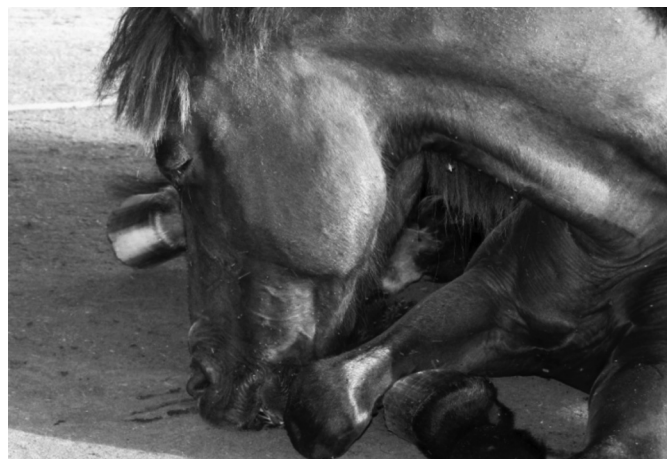
Fig.4. Dificuldade de sustentação da cabeça (Equino 1).

Verificaram-se aumento das frequências cardíaca e respiratória em todos os animais; e temperatura retal diminuída nos Equinos 1, 2 e 4, a partir das 17h47min, 6h e 18h, respectivamente, após a inoculação do veneno.