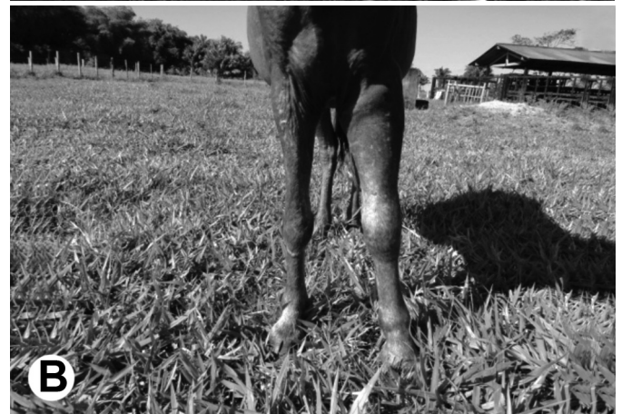
Fig.1A,B. Aumento de volume no membro inoculado no envenenamento crotálico (Equinos 4 e 2, respectivamente).