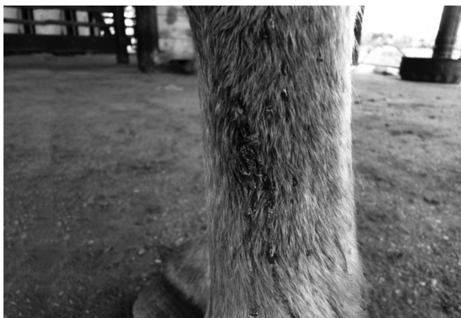
Fig.2. Líquido serossanguinolento drenando da pele íntegra (Equino 2).

Outros sinais foram apatia (Equinos 1, 3 e 4) (Fig.3), letargia caracterizada por sonolência com tendência em permanecer com a cabeça baixa (Equinos 1, 2 e 5) (Fig.4), edema nos maxilares e acima das pálpebras (Equino 1), ptose auricular (Equino 4), vasos episclerais ingurgitados (Equinos 1, 3, 4 e 5), mucosa ocular hiperêmica (Equinos 3 e 4), sangue nas narinas (Equino 4), dispneia (Equino 1), aumento de linfonodos pré-escapulares e parotídeos (Equinos 4 e 5), submandibulares (Equinos 2, 3 e 5) e pré-crural (Equino 3), e flacidez da cauda (Equino 1).