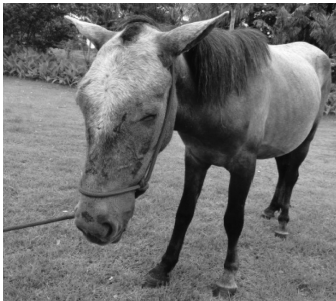
Fig.3. Apatia (Equino 4).