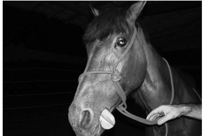
Fig.6. Redução do tônus lingual (Equino 1).

Achados de necropsia. Os achados de necropsia foram edema no local da inoculação, estendendo-se às áreas adjacentes a esse ponto (Equino 2) ou por toda a extensão do membro (Equino 1). No coração observaram-se sufusões no epicárdio do ventrículo esquerdo e direito acompanhando o sulco coronário longitudinal (Equino 1) e petéquias no sulco coronário (Equino 2). Verificou-se, ainda, grande área hemorrágica com 20 cm de diâmetro no útero (Equino 1), bexiga com áreas hemorrágicas em grande parte da mucosa (Equino 2).