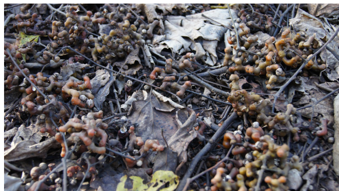
Fig.1. Frutos maduros de “uva-Japão” ( Hovenia dulcis ) caídos ao chão.

Levantamentos de históricos foram efetuados com produtores e veterinários nos municípios da região Oeste e Meio-Oeste de Santa Catarina. Para experimentação, foram coletados frutos maduros, colhidos do chão (Fig.1) nos municípios de Concórdia, São José do Cedro, Joaçaba e Erval Velho. Os frutos foram administrados, por via oral, em dose única para nove bovinos. Foram utilizados bovinos machos e fêmeas, todos provenientes de propriedades livres dos frutos de “uva-Japão”. Os bovinos foram divididos em dois grupos. Grupo I: os que receberam somente o fruto maduro (Bov. 143, 144, 150 e 152) e Grupo II: os que receberam o fruto maduro associado à silagem de milho ad libitum (Bov. 147, 148, 149, 151 e 153). O delineamento do experimento com frutos maduros de Hovenia dulcis está representado no Quadro 1. Todos os bovinos do experimento foram mantidos em baias, alimentados com trevo branco ( Trifolium repens ) e azevém ( Lolium multiflorum ), e água foi fornecida ad libitum . Os bovinos foram acompanhados, com avaliações clínicas várias vezes ao dia. Um bovino foi necropsiado e fragmentos das principais vísceras foram coletados para exame