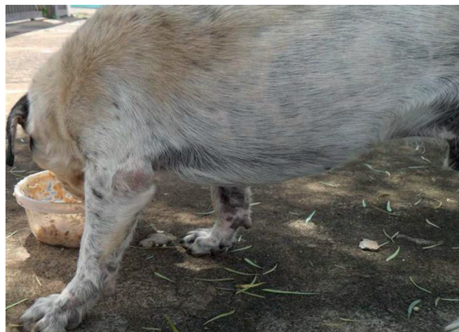
Fig.2. Cão 70080, grupo I tratado, no momento experimental D+28. Observar as regiões anteriormente acometidas pelo ácaro como cotovelos e dedos com crescimento de pelo e ausência de eritema.

e escamas, espessamento da pele, escoriações resultantes do ato de coçar, hiperemia e prurido. As lesões se localizaram em grande parte nas regiões das bordas das orelhas, cotovelos, calcanhares e dedos. No dia D-7, fichas dermatológicas determinando o local das lesões a as características das mesmas foram preenchidas para cada animal (Fig.1). A partir do D+14, as lesões dermatológicas apresentaram melhoras evidentes com diminuição de eritema, prurido, e crescimento de pelos nas áreas alopécicas nos animais do grupo I e II. No dia +28, foi observado remissão dos sinais clínicos em 100% dos animais (Fig.2).