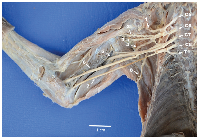
Fig.2. Vista ventral do plexo braquial do sagui-de-tufos-brancos ( Callithrix jacchus ). Nervo supraescapular (1), nervo musculocutâneo (2), nervo axilar (3), nervo subescapular (4), nervo radial (5), nervo mediano (6), nervos ulnar (7), nervo toracodorsal (8). Nervo cervical 5 (C5), nervo cervical 6 (C6), nervo cervical 7 (C7), nervo cervical 8 (C8), nervo torácico 1 (T1).