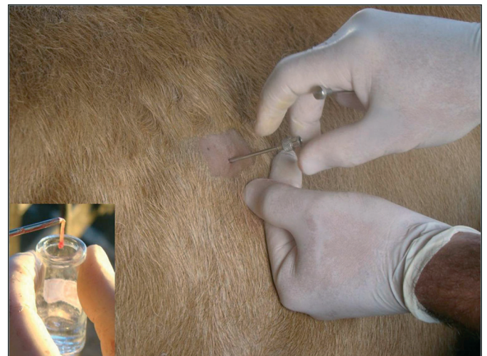
Fig.2. Realização de biópsia hepática em um bovino por acesso percutâneo e transtorácico no penúltimo espaço intercostal. No detalhe observa-se fragmento de fígado coletado com aproximadamente 1,5cm de comprimento por 0,1cm de espessura a ser acondicionado em frasco com formol a 10% para posterior avaliação histopatológica.

caracterizou-se por emagrecimento progressivo, diarreia escura, apatia, dificuldade de locomoção e agressividade. Alguns bovinos foram necropsiados por médicos veterinários autônomos em nove propriedades e os principais