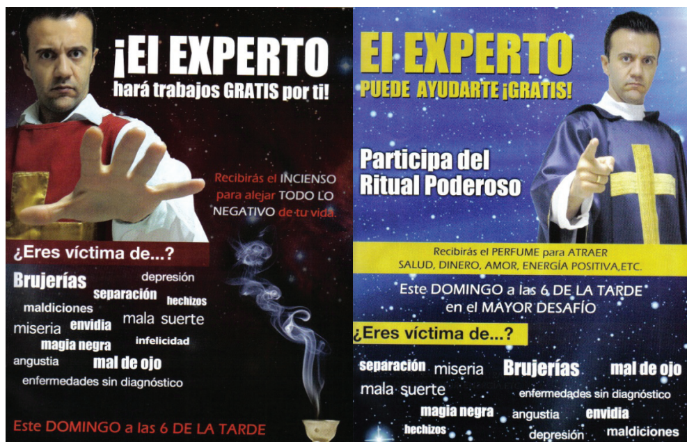
Figura 2: Propagandas da revista Familia Unida que a IURD distribuiu na Espanha. 11

Abaixo vemos imagens de algumas propagandas da IURD na Espanha e que exploram as características culturais ligadas às noções de magia e esoterismo e que, segundo Javier e outros interlocutores espanhóis, seriam inerentes à espiritualidade tradicional deste país: