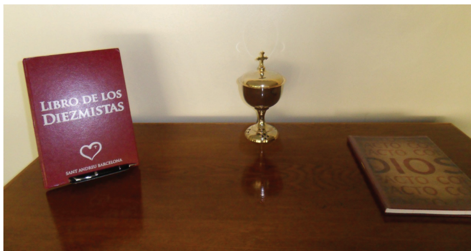
Figura 3: Livro dos dizimistas do templo da Família Unida de San Andreu