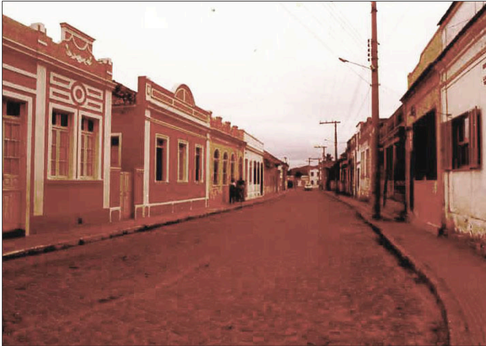
Figura 6: Aspectos da arquitetura do Centro Histórico de Laguna à época do tombamento federal. Fonte: Iphan (1984). Apenso II do Processo de Tombamento n. 1122-T-84

[...] impedir o desaparecimento do mais rico conjunto urbano existente no Sul do Brasil com implicações históricas profundas no contexto nacional tais como a passagem do sul meridiano de Tordesilhas, núcleo de expansão rumo ao atual território do Rio Grande do Sul, sede da República Juliana, berço de Anita Garibaldi, testemunho vivo da passagem pelo Brasil de José Garibaldi. (INSTITUTO..., 1984g, p. 11)