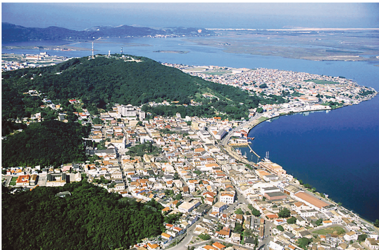
Figura 1: Vista aérea do Centro Histórico de Laguna/SC.

O estudo de tombamento da cidade de Laguna pode ser considerado o ponto de inflexão nas práticas de preservação dos anos da redemocratização (SANT'ANNA, 1995; MOTTA, 2000a). As argumentações mobilizadas em favor da preservação de uma cidade em que os processos sociais e econômicos estavam presentes no seu espaço construído trouxeram novidades para o campo, dentre as quais, o uso das argumentações da história. Em Laguna, os bens imóveis da cidade foram olhados como conjunto e não como somatório de edificações de valor arquitetônico.