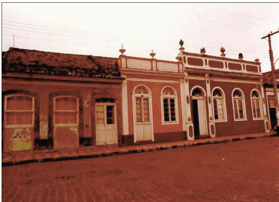
Figuras 4 (acima) e 5: Aspectos da arquitetura do Centro Histórico de Laguna à época do tombamento federal. Fonte: Iphan (1984). Apenso II do Processo de Tombamento n. 1122-T-84

Interessante observar que a argumentação pela história dos eventos (factual e narrativa) para justificar o tombamento da cidade havia sido anunciada no ofício do prefeito de Laguna com o pedido de preservação. Sua preocupação era evidenciar a importância da cidade no contexto nacional para