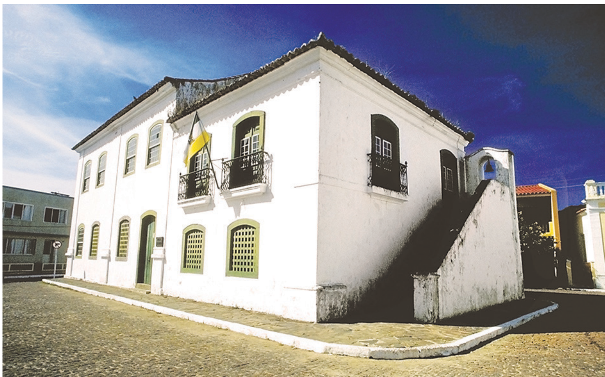
Figura 2: Casa de Câmara e Cadeia de Laguna/SC, tombada pelo Iphan.