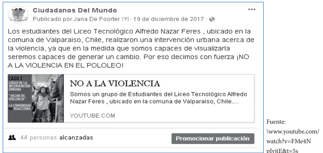
Figura 4. Pantallazo de la pieza comunicativa derivada de la intervención urbana.

identificaron causas culturales como la concentración del poder, el machismo, las prácticas de opresión o las diferencias de género, y definieron que la violencia en las relaciones más cercanas era la que más les afectaba, especialmente “la violencia en el noviazgo”. Una vez identificada la problemática se diseñó una intervención urbana con el propósito de realizar una simulación de violencia verbal en el noviazgo, en el transporte público de Valparaíso (Fig. 4).