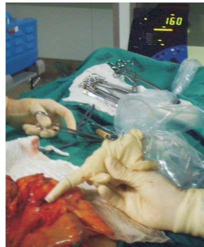
Figura 2 - Fotografia digital da identificação peroperatória dos linfonodos captantes por meio do gama probe.

A identificação dos linfonodos-sentinela foi: a) visual depois de 5-10 minutos da injeção do azul patente, com os primeiros linfonodos corados marcados com fio prolene; b) utilizada sonda captadora de raios gama (Eurorad®) no intra-operatório para localizar linfonodos no mesocólon depois de 20-30 minutos da injeção do radiofármaco, que são marcados com fio seda (figura 2); c) adicionalmente leva-se o espécime cirúrgico fresco removido até a clínica de medicina nuclear para obter imagem cintilográfica (figura 3).