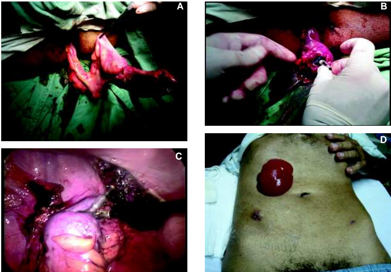
Figura 3 - A. Extração transanal completa do espécime com intacto envelope da excisão mesorretal. B. Resseção transanal do retossigmoide mobilizado e preparação do coto proximal com ogiva do grampeador circular. C. Anastomose circular grampeada. D. Aspecto externo do abdome no 10º DPO.

dos trials em Comitês de Ética e Pesquisa clínica em cirurgia por orifícios naturais em diferentes países. Até o momento, foram publicados 195 casos humanos mundialmente, e ainda outros 362 casos incluídos no estudo multicêntrico internacional IMTN NOTES Multicenter Study 13 , na maior parte descrevendo baixas taxas de complicações. Desde que Zorron e cols, Marescaux e cols, Zornig e cols, e Branco e cols descreveram bem-sucedidas colecistectomias NOTES por via transvaginal em 2007 14-17 , outros grupos seguiram e publicaram seus resultados clínicos iniciais das técnicas, na maior parte com assistência laparoscópica para propósito de retração ou visualização 18-28 . Apendicectomia transgástrica foi também apresentada clinicamente em congressos por Rao e Reddy utilizando material endoscópico disponível desde 2005 29 , e recuperação bem-sucedida de gastrostomia foi descrita por Marks e cols 30 . Apendicectomia NOTES transvaginal foi ini-