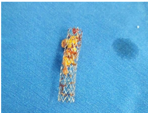
Figura 3. Stent removido da bexiga com presença de debris celulares aderidos ao seu lúmen.

Não houve o retorno conforme solicitado e também não foi seguida a terapia antibiótica prescrita. Após dois meses do procedimento, esse paciente retornou para nova avaliação. Apresentava micção urinária espontânea, o stent uretral permanecia fixo, como posicionado inicialmente, porém ainda apresentava sinais de infecção no trato urinário inferior. Foi realizada cistotomia para retirada do stent que havia migrado para a bexiga (Fig. 3) e procedeu-se à cultura e ao antibiograma desse material, que demonstrou crescimento profuso de Klebsiella sp. multirresistente. Após esse procedimento, iniciou-se a terapia com ceftriaxona 30mg/kg BID. Em contato com o proprietário por telefone, ele relatou que interrompeu a terapia por conta própria e que o paciente estava urinando normalmente.