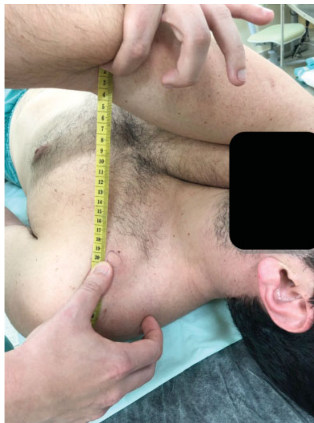
Fig. 2 Posição supina adotada durante o exame físico mostrando a distância entre o processo coracoide e a fossa cubital.