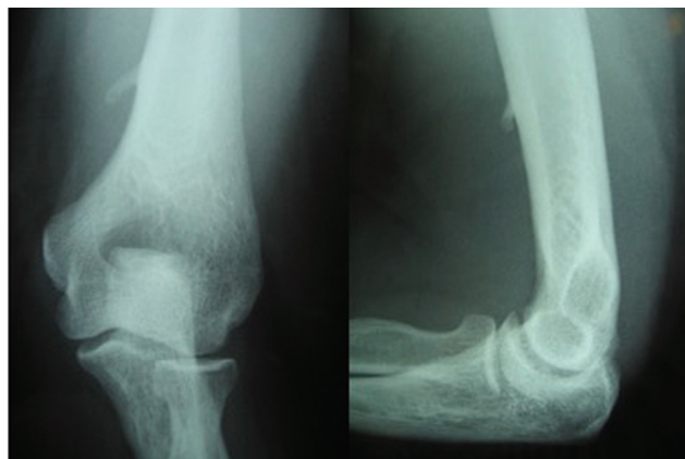
Fig. 1 Radiografias (incidência de face e perfil) do cotovelo esquerdo onde se observa a apófise supracondilar do úmero distal.

A paciente foi submetida à cirurgia para excisão desta estrutura por uma via anterior do úmero distal. Intraoperatóriamente confirmou-se a compressão do nervo mediano