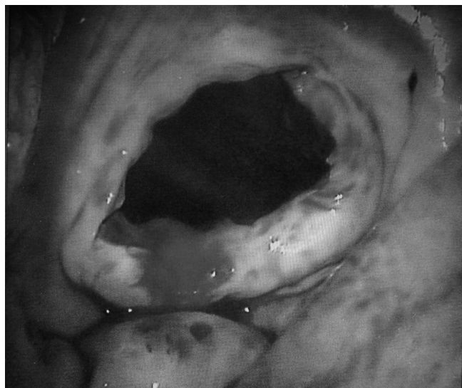
Fig. 2 - Técnica proporciona boa visibilidade