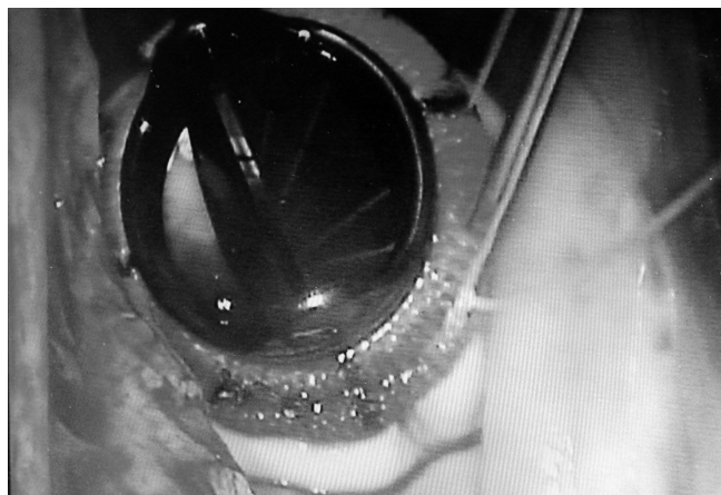
Fig. 3 - Fixação da valva protética