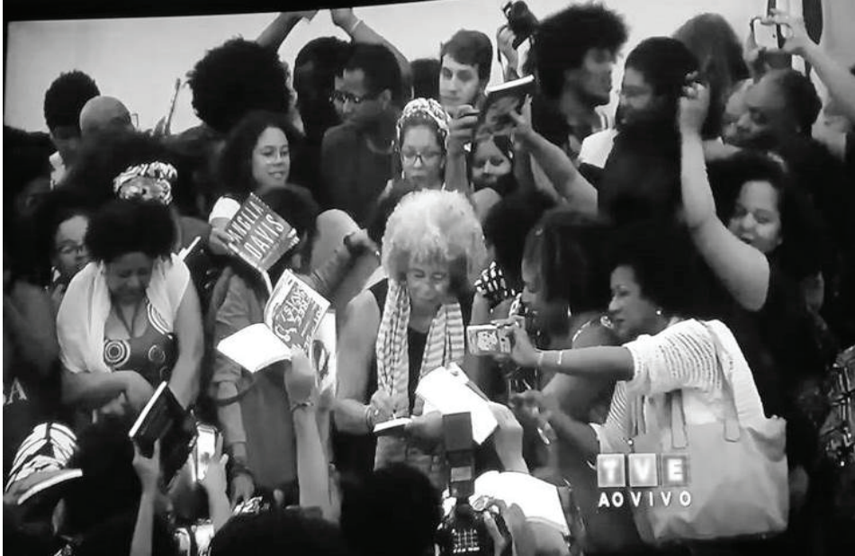
Imagem 4. Pessoas com o livro Mulheres, raça e classe durante a palestra de Davis na UFBA Fonte: Davis (2017a)