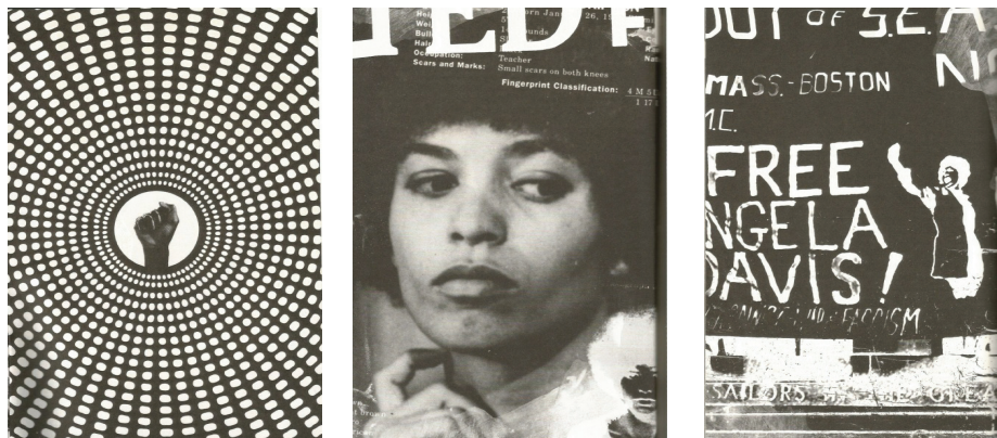
Imagem 3. Imagens que antecedem ao prefácio