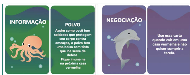
Figura 3. Exemplo de cartas de informação e negociação do jogo de tabuleiro “Skuba! Uma aventura no fundo do mar”, frente e verso