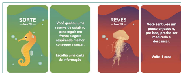
Figura 2. Exemplo de cartas de sorte e revés do jogo de tabuleiro “Skuba! Uma aventura no fundo do mar”, frente e verso