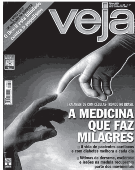
Figura 1. A cultura científica depende de conteúdos religiosos para assegurar eficácia retórica