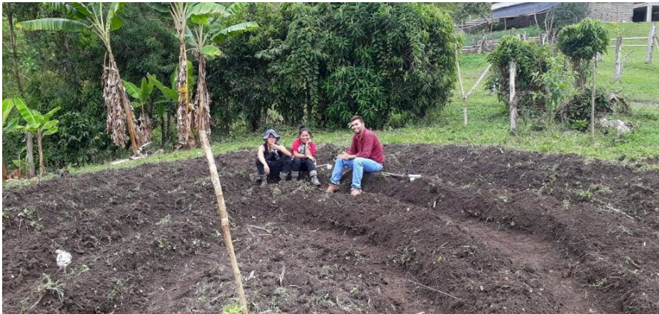
Ilustración 1. Tul: Terreno de cultivo Nasa

Para el pueblo Nasa el tul, lo mismo que el uso de semillas nativas, se constituyen en escenario de vital importancia y la principal fuente de abastecimiento de alimentos sanos y culturalmente apropiados para el autoconsumo familiar.