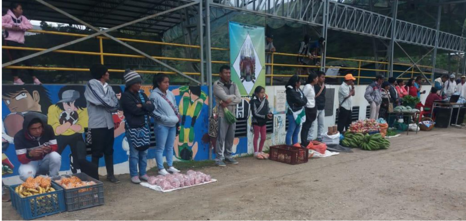
Ilustración 2. Mercado Nasa

Durante el confinamiento por COVID-19 fue evidente la dificultad para el ingreso de alimentos externos, fue así que el trueque se revitalizó; en este caso mediante el Mercado Nasa, espacio en el que las familias sacaban su producción los domingos para el intercambio interno (trueque).