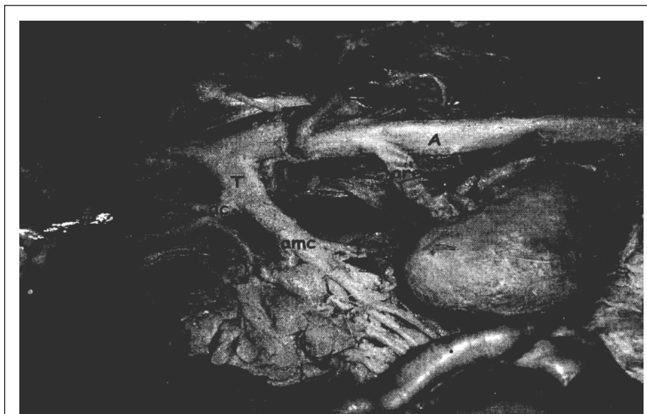
Figura 2 – Fotografia da região abdominal de um canino evidenciando a artéria aorta abdominal (A) e a emergência comum da artéria celíaca (ac) e da artéria mesentérica cranial (amc) pelo tronco celíaco-mesentérico (T). Observa-se a artéria renal esquerda (are) e a ramificação da artéria celíaca em artéria hepática (ah), artéria gástrica esquerda (age) e artéria esplênica (ae).

presença do tronco celíaco-mesentérico, esta pode ser considerada uma variação anatômica. Estudos posteriores englobando um número maior de animais podem esclarecer em que situação se enquadra a espécie canina.