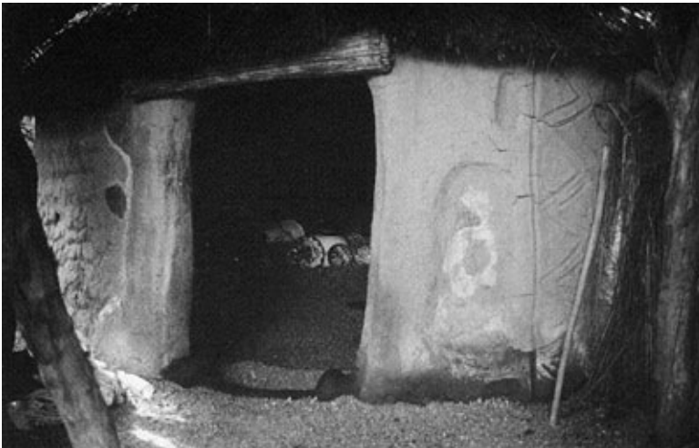
Foto 2. Uma cabana contemporânea na mesma aldeia.

Este exemplo simples de analogia, que apresenta elementos enumerativos, e também relacionais, emprega os mesmos conceitos – objeto, fonte, componentes neutros, positivos e negativos, argumentos a respeito de rela-