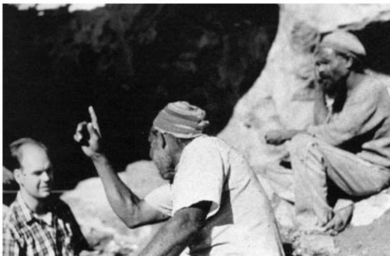
Foto 3. Richard Gould com informantes Ngatatjara em Puntutjarpa Rockshelter, Warburton Ranges, oeste da Austrália, em julho de 1967.

Pedras isotrópicas de origem exótica servem assim como uma “assinatura arqueológica” de um modo de adaptação caçador-coletor, não-sazonal e redutor de riscos do Deserto Ocidental da Austrália e, provavelmente, de qualquer outro lugar onde fatores limitantes similares tenham afetado assentamentos humanos.