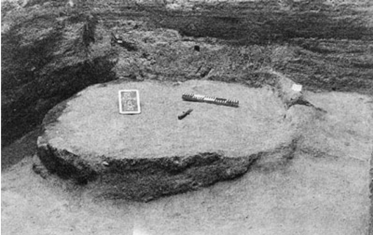
Foto 1. Os restos de uma estrutura escavada por ND na aldeia Fulba (Fulani) de Bé, Norte de Camarões, em 1968.