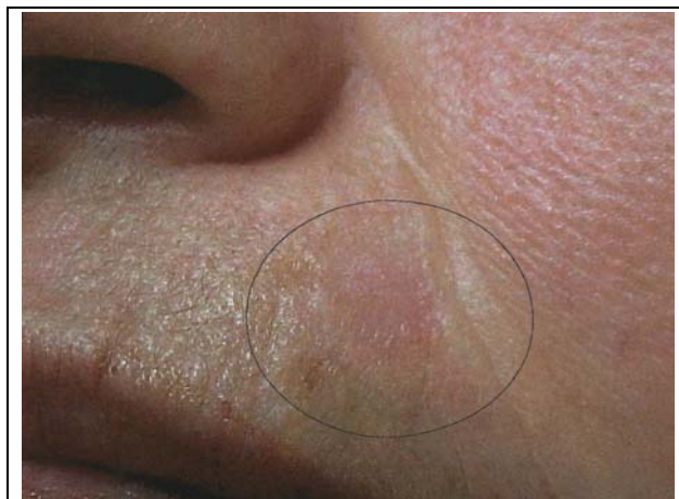
Figure 1: Erythematous and slightly atrophic oval-shaped lesion, localized on the upper left lip