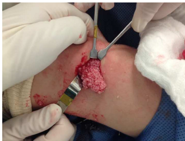
Figura 2 – Aspecto macroscópico da sinóvia de joelho esquerdo, que mostra uma moderada quantidade de massa esbranquiçada, semelhante a grãos de arroz.