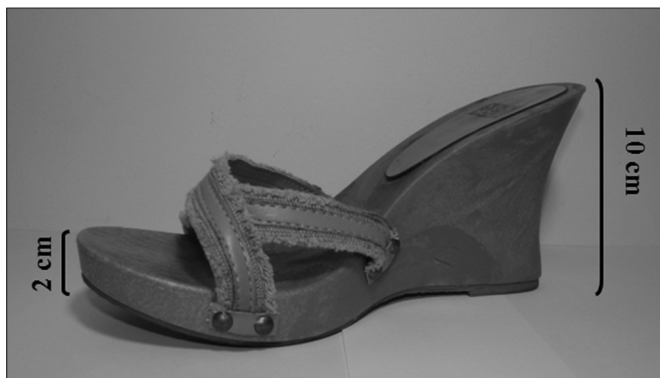
Figura 1. Calçado de salto alto usado neste estudo.

Para esta análise, foi utilizada a fotogrametria e os registros fotográficos foram realizados em uma sala iluminada e privativa. Foi utilizada uma câmera fotográfica digital SONY – H 7 de 8,1 mega pixels posicionada paralela ao solo, sobre um tripé a 1,0 m de altura do solo, a uma distância de 2,40 m do local onde as adolescentes se posicionaram para que o corpo todo pudesse ser fotografado 21 . A câmera foi girada e travada a 90° da posição horizontal a fim de focalizar longitudinalmente o corpo da adolescente. Durante a avaliação fotogramétrica do retro pé, as adolescentes permaneceram em ortostatismo ao lado de um fio de prumo, a uma distância de