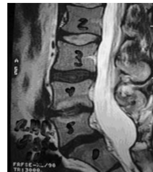
Figura 1 - Imagem por ressonância nuclear magnética da coluna em corte sagital, mostrando discopatias nos níveis L3-L4, L4-L5 e L5-S1 (discos pretos).

O grau de intensidade da doença foi identificado de acordo com a classificação de Schneider modificada (5) . Nesse caso o Grau 1 foi caracterizado como a presença