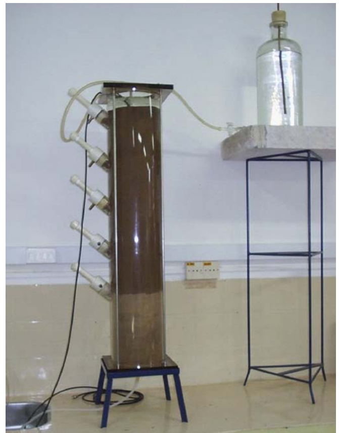
Figura 2. Início da saturação do solo mostrando a passagem da água do frasco de Mariotte para a coluna

Com vistas à simulação do movimento de água dentro da coluna utilizou-se um frasco de Mariotte que viabiliza uma carga hidráulica prédefinida. A Figura 2 mostra o início da saturação do solo e a passagem da água do frasco de Mariotte para a coluna.