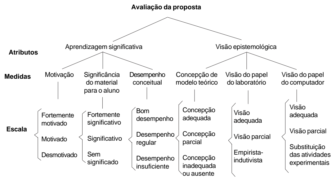
Figura 2. Esquema de avaliação de nossa proposta didática (DORNELES, 2010).

Consideramos que nosso material possui estrutura lógica, pois foi validado por dois especialistas no assunto (professores das aulas teóricas e experimentais, segundo e terceiro autor do presente trabalho, respectivamente). Em relação aos alunos possuírem conhecimento prévio em sua estrutura cognitiva, para acompanharem as explicações e os raciocínios propostos no material, buscamos indicadores sobre o desempenho dos alunos nas tarefas e opiniões sobre o material.