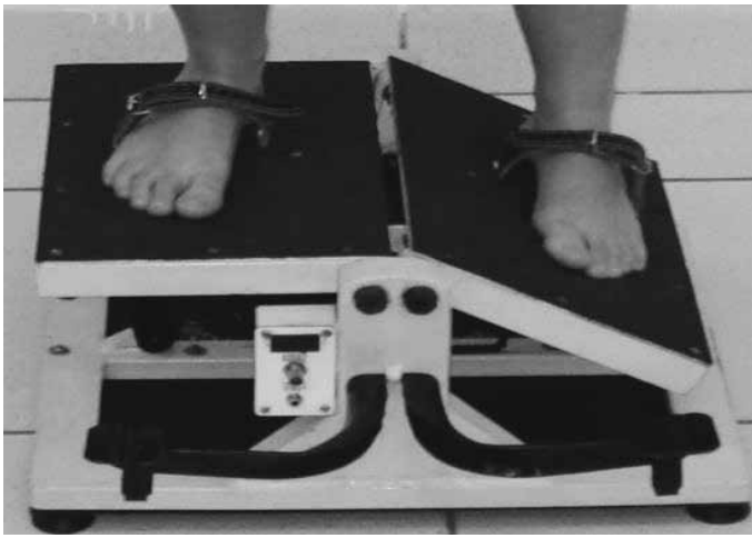
Figura 1. Simulação da entorse em inversão sobre a plataforma.