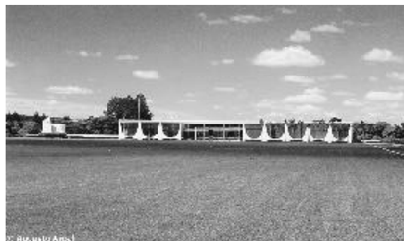
Figura 9 - Palácio da Alvorada

Do grande terraço suspenso que conforma a Praça dos Três Poderes é possível avistar o Palácio da Alvorada (figura 09), residência oficial do Presidente da República, que está situado numa cota mais baixa do sítio de implantação do Plano Piloto, conformado pelo Lago Paranoá. A área de entorno do Palácio é caracterizada pela topografia plana e por uma cobertura vegetal remanescente do cerrado brasileiro. Esses condicionantes da paisagem natural foram intencionalmente preservados no projeto paisagístico de Burlle Marx, com o objetivo de valorizar o bioma e as características ambientais do Planalto Central do Brasil.