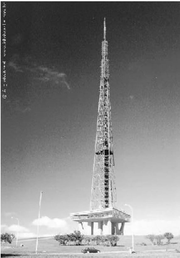
Figura 13 - Torre de TV

projetada também por Lucio Costa, funcionando também como mirante. É o ponto mais alto de todo o Plano Piloto, com 1.224m, onde é possível ter uma visão completa do Plano Piloto. A torre é uma referência de Lucio Costa à Torre Eiffel de Paris. Para o turismo a torre é um local bastante visitado e um marco referencial da paisagem urbana, pois ela associa o valor da atratividade proporcionada por seu mirante de observação da cidade, um museu e a feira de artesanatos.