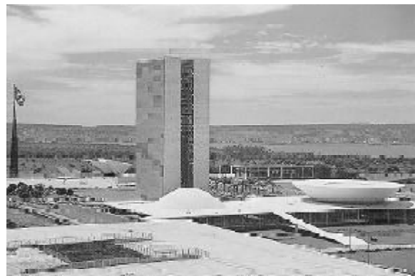
Figura 5 - Congresso Nacional

A Praça dos Três Poderes é um amplo espaço cívico que circunscreve o edifício do Congresso Nacional (figura 05), sede do Poder Legislativo, o Palácio do Planalto (figura 06), sede do poder executivo e o Supremo Tribunal Federal, sede do Poder Judiciário. Esse local, como o próprio nome sugere, representa a união dos poderes e, teoricamente, dá significado a história não só da capital federal, mas do país como um todo.