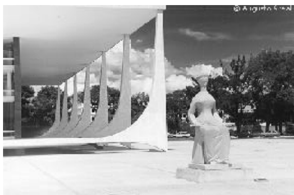
Figura 7 - Escultura "Justiça"

Assim, a paisagem concreta, ou a paisagem materializada que conforma a Praça dos Três Poderes, extrapola sua dimensão física, emanando significados e representações por todo o país devido aos fatos e medidas que ali se originam. Nessa paisagem ainda é possível apreciar as esculturas Os Guerreiros (figura 8), de Bruno Giorgi, A Justiça (figura 7), de Alfredo Ceschiatti, a Pira da Pátria e o Marco Brasília, de Niemeyer, em homenagem ao ato da UNESCO que considerou a cidade Patrimônio Cultural da Humanidade. Esses monumentos agregam mais representatividade simbólica à Praça dos Três Poderes, já que cada indivíduo se apropria do fato construído codificando seus próprios significados.