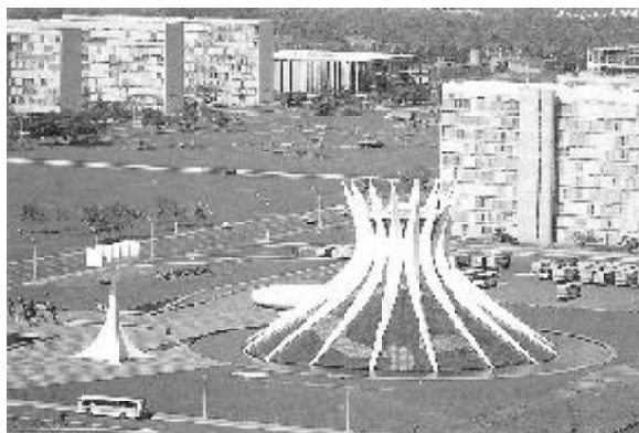
Figura 11 - Esplanada dos Ministérios e Catedral.

A catedral de Brasília é um exemplar da arquitetura grandiosa de Oscar Niemeyer. Neste projeto o autor faz uma releitura da disposição do conjunto arquitetônico de Miguel Ângelo para a Catedral de Florença na Itália – nave, batistério e campanário – mas mantém a sua própria expressão arquitetônica, além de dotar à nave de uma planta circular em desnível e de uma cúpula que emerge do plano do terreno e se abre em direção ao firmamento. Esta cúpula é composta por 16 pilares curvos de concreto unidos pelos painéis de vitrais que dão leveza ao conjunto e possibilita a entrada da luz natural ao interior do templo (figura 12).