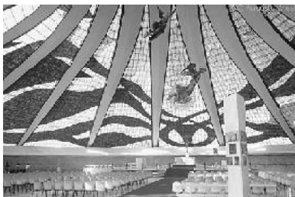
Figura 12 - Interior da Catedral

Além disso, a catedral de Brasília possui um expressivo acervo de obras de arte: no lado externo, as esculturas dos quatro evangelistas, de Alfredo Ceschiatti, os vitrais de Marianne Peretti, as pinturas de Di Cavalcante e um painel no batistério em cerâmica de Athos Bulcão.