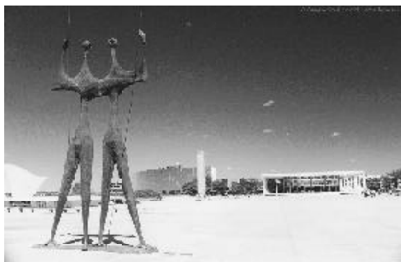
Figura 8 - Os "Guerreiros"