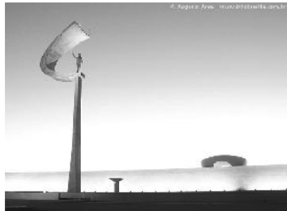
Figura 14 - Memorial JK

Então, chegamos à Praça do Cruzeiro, “o marco zero” que além de ser a cota mais elevada do Plano Piloto, 1172m, simboliza o lugar escolhido para a abertura do Eixo Monumental.