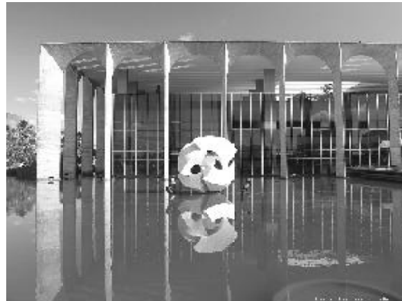
Figura 10 - Palácio do Itamaraty e o "Meteoro".

A partir da Praça dos Três Poderes, no sentido oposto à visão do Palácio da Alvorada, se descortina a Esplanada dos Ministérios. No primeiro plano, uma edificação de destaque na paisagem é o Palácio do Itamaraty, sede do Ministério das Relações Exteriores do Brasil. É uma das obras mais conhecidas de Niemeyer, possui a fachada em arcos e painéis decorativos de vários artistas, como Athos Bulcão, Rubem Valentim, Sérgio Camargo, Maria Martins, além de um afresco de Alfredo Volpi e, por fim, é rodeado por um espelho d'água que serve de cenário para a famosa escultura O Meteoro, de Bruno Giorgi (figura 10). Neste exemplo, mais uma vez a categoria de conteúdo pelo detalhamento de suas características é relevante, já que situam as obras no tempo e as individualizam, assim como a valorização do espaço interno e externo através da arquitetura paisagística de Burle Marx.