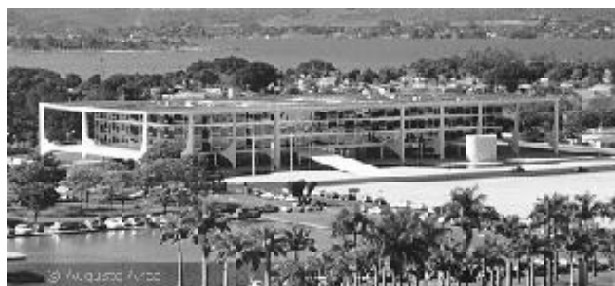
Figura 6 - Palácio do Planalto