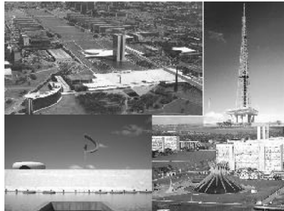
Figura 4 -Praça dos Três Poderes, Torre de TV, Catedral, Memorial JK.