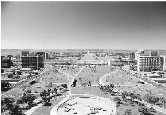
Figura 3 - Vista da Torre de TV - Eixo Monumental

As fachadas envidraçadas espelham a cidade, multiplicando o reflexo das belas imagens arquitetônicas como um sonho futurista. Essa descrição expressa claramente o aspecto mais amplo do conteúdo, abrangendo uma visão geral da cidade. (COSTA, 1991, p. 17)