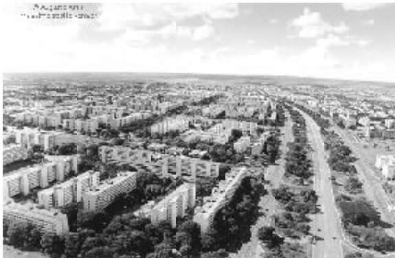
Figura 2 - Vista Panorâmica - Asa Norte.