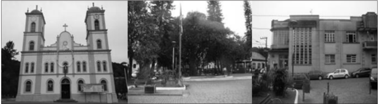
Figura 7 – Conjunto de edifícios composto pela igreja, praça e o Cine X

Junto ao largo da Igreja, está a Praça Getúlio Vargas, cujo tipo de implantação segue os moldes das cartas régias portuguesas do período barroco, há uma massa de vegetação que individualiza a paisagem, promove o contraste entre os dois lados da via, um fechado e o outro repleto de edificações construídas ao rés-do-chão, ocupando todo o lote, sendo uma implantada junto à parede limite da outra, figura 7 (AUGUSTO-FRANÇA, 2009).