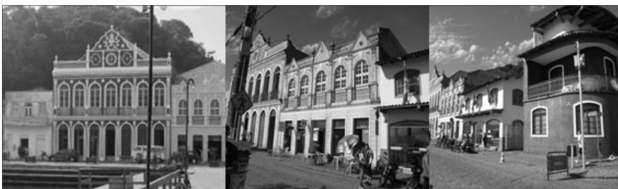
Figura 10 – Fechamento do roteiro, Clube XXIV de Janeiro e o conjunto de edifícios, implantados na margem oposta à Baía de Babitonga