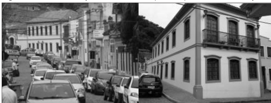
Figura 6 – Vista do conjunto de edifícios que compõe o acive do trajeto 2

Ao ingressar no trajeto 2, surge um acive que culmina com a vista de uma edificação monumental, edifício com uma arquitetura repleta de ornamentos, com aberturas em arco abatido, cimalhas e guarda-corpo de ferro, com uma marcação entre os dois pavimentos, semelhante às tipologias de edificações descritas na regulamentação da cidade pombalina de Lisboa (PT). À medida que a inclinação aumenta, a rua se fecha, cria uma perspectiva velada, figura 6.