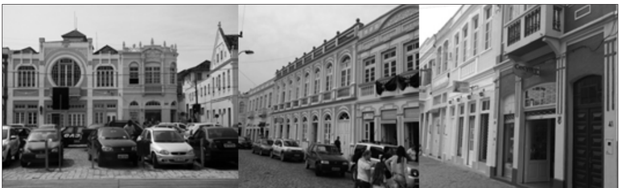
Figura 4 – Conjunto de edifícios que compõe o lado oposto a Baía de Babitonga.

Na sequência, identifica-se a complexidade de edificações históricas, primeiro individualmente, depois em conjunto, figura 4. Observa-se que, nos dois lados da via, há edificações de valor histórico, fazendo com que a paisagem desse entorno seja composta por um conjunto urbano em estilo eclético, que data do fim do século XIX, início do século XX. Algumas casas ocupam toda fachada do lote, estão construídas sobre o alinhamento da via pública e sobre os limites laterais do terreno. Essa tipologia de ocupação dos lotes em fita data do período colonial, e os edifícios são de arquitetura eclética, estilo arquitetônico típico do início do século XIX (REIS FILHO, 1970).