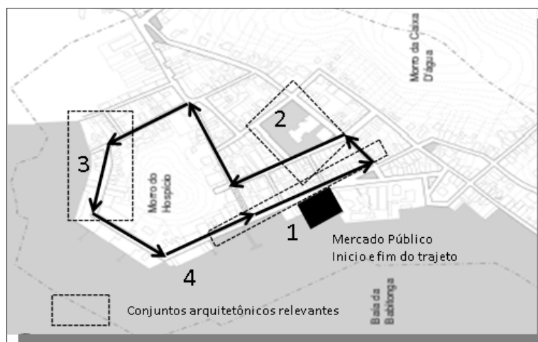
Figura 2 – Roteiro com os trajetos da pesquisa de campo, numerados de acordo com a sequência do percurso e a relevância histórica.

Fonte: Acervo do ETEC SFS IPHAN, 2010. Informações adicionadas pelo autor, 2014.