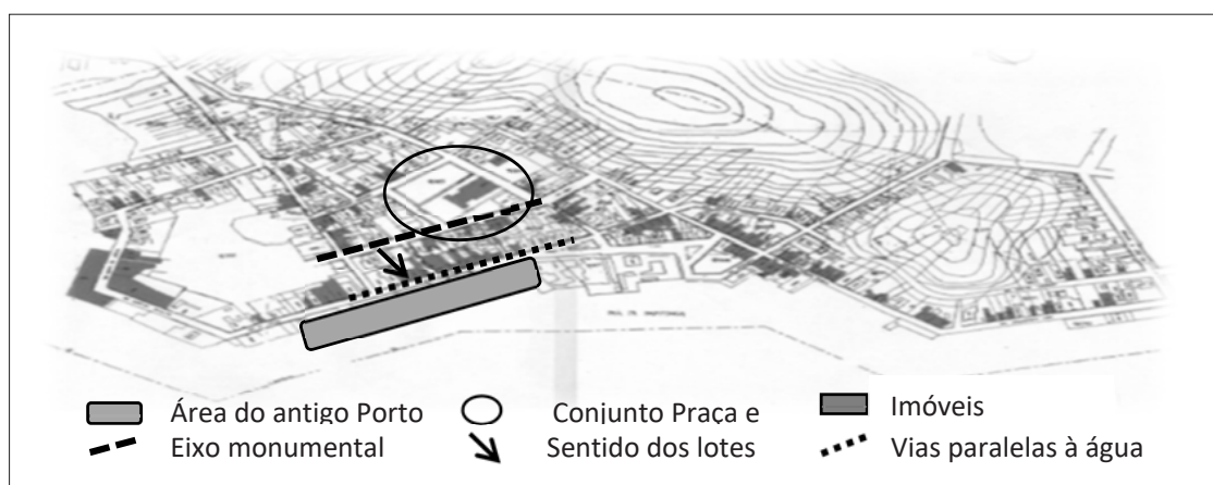
Figura 1 – Mapa da Cidade de São Francisco do Sul (BR)