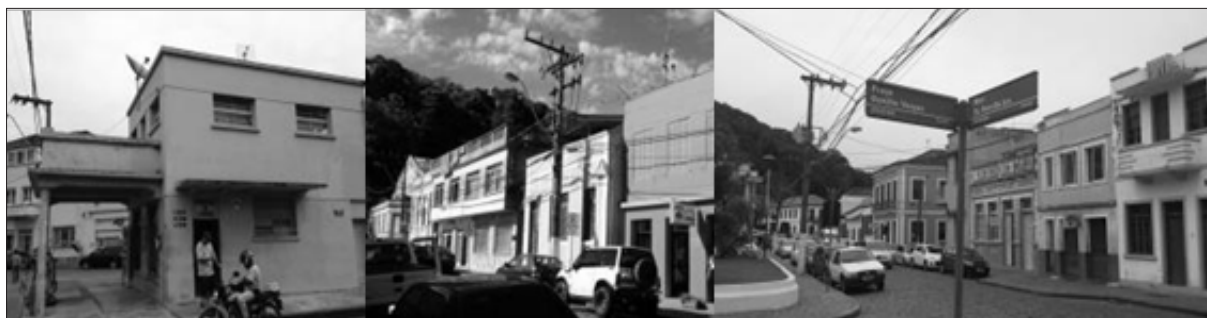
Figura 5 – Conjunto de edifícios que compõe o lado oposto a Baía de Babitonga

edifício, posto de gasolina, de tipologia arquitetônica racionalista típica do início do modernismo no Brasil (REIS FILHO, 1970).