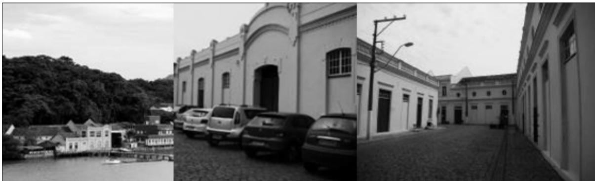
Figura 9 – Trajeto 4, Museu do Mar