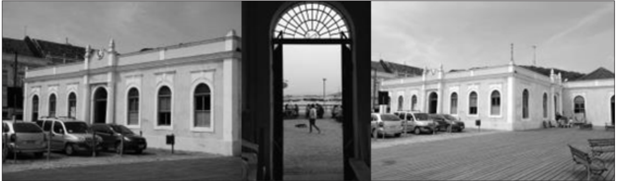
Figura 3 – Mercado Público, vista externa e vista de dentro para fora

O Mercado Público, edifício construído no ano de 1900 (IPHAN, 2010). É um edifício que contrasta na paisagem, caracteriza-se como uma iniciativa local que aponta uma sucessão de pontos de vista. As aberturas dessa construção são ricas em pormenores, com detalhes em ferro e cimalkhas de argamassa, propiciam a vista do exterior para o interior. Esse edifício reduz a magnitude de sua paisagem, perspectiva velada, quando volta as costas para a Baía de Babitonga. Já junto a Baía, a perspectiva é grandiosa, apesar de ser um dos limites físicos dessa área. Sendo assim o traçado urbano inicial parte da área do antigo porto e a conecta com a parte alta da cidade, figura 3.