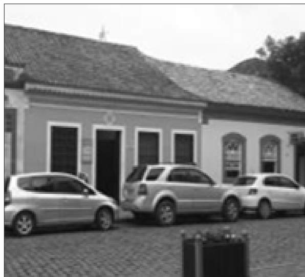
Figura 8 – Conjunto de edifícios residenciais e comerciais que compõe o lado oposto ao igreja.

Os edifícios da figura 8 foram construídos ao rés-do-chão, possuem tipologia arquitetônica típica do período colonial, com um acesso principal e duas janelas e ocupação total do lote, em fita (REIS FILHO, 1970).