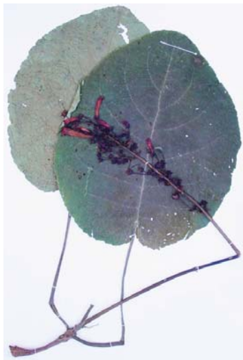
Figura 2. Exsicata de Sinningia gigantifolia , depositada no Herbário Dom Bento Pickel (SPSF), sob o número 32.976.

Figure 2. Specimen of Sinningia gigantifolia from Pedra do Baú deposited in the Dom Bento Pickel Herbarium.