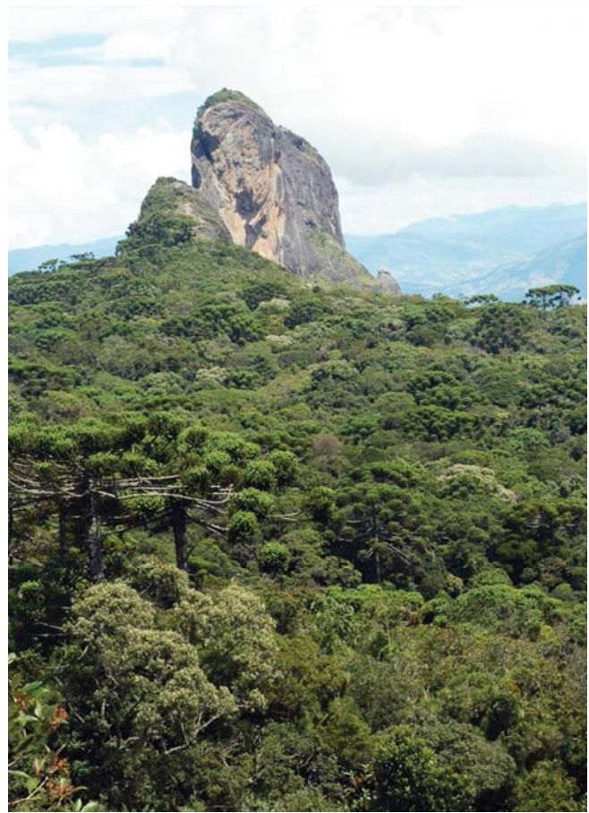
Figura 1. Pedras do Bauzinho e do Baú e remanescente de Floresta Ombrófila Mista, São Bento do Sapucaí-SP.

Para a análise sobre a distribuição e o habitat da espécie foram selecionados registros de Sinningia gigantifolia , do banco de dados de Alain Chautems. O objetivo foi abranger o conjunto de municípios onde a espécie foi coletada, e incluir aqueles registros que contivessem informações mais detalhadas sobre o local de coleta: Minas Gerais – Alto do Caparaó , I.2001, Leoni nº 4.569 (GFJP); Camanducaia , XII.2001, Meireles nº 780 (UEC); Extrema , s.dat., Yamamoto nº 940, 1068 (UEC); Faria Lemos , VI.2003, Leoni nº 5.355 (GFJP); Serra da Araponga , X.1994, Leoni nº 2.661 (GFJP); Serra do Boné , IV.1994, Leoni nº 2.501 (GFJP); Rio de Janeiro – Itatiaia , III.1894, Ule no 206 (R); Itatiaia , II.1899, Gounelle s.n. (G); Itatiaia , III.1960, Martins nº 165 (GUA,R); Itatiaia , I.1987, Chautems et al. nº 206 (G); Itatiaia , XI.1994, Braga et al. nº 1.675 (RB); Itatiaia , X.1997, Silva Neto