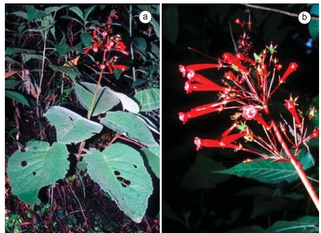
Figura 3. Detalhes de Sinningia gigantifolia na Serra dos Órgãos, RJ. a) vista geral da planta; b) detalhe da inflorescência

Na Serra do Baú, o local de ocorrência é a base da Pedra do Bauzinho, em ambiente sombreado e úmido, sobre rocha, no interior