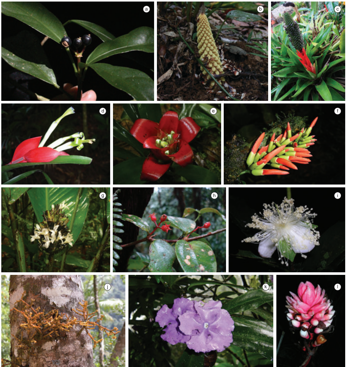
Figura 2. Algumas espécies ocorrentes no interior do Parque Estadual Carlos Botelho. a) Dendropanax australis (Araliaceae). b) Lophophytum leandrii (Balanophoraceae). c) Aechmea ornata (Bromeliaceae). d) Billbergia amoena (Bromeliaceae). e) Nidularium amazonicum (Bromeliaceae). f) Dahlstedtia pinnata (Fabaceae). g) Calathea monophylla (Marantaceae). h) Pleiochiton blepharodes (Melastomataceae). i) Eugenia bocainensis (Myrtaceae). j) Phoradendron fragile (Santalaceae). k) Brunfelsia pauciflora (Solanaceae). l) Renealmia petasites (Zingiberaceae).

Figure 2. Some of the species occurring in the Carlos Botelho State Park. a) Dendropanax australis (Araliaceae). b) Lophophytum leandrii (Balanophoraceae). c) Aechmea ornata (Bromeliaceae). d) Billbergia amoena (Bromeliaceae). e) Nidularium amazonicum (Bromeliaceae). f) Dahlstedtia pinnata (Fabaceae). g) Calathea monophylla (Marantaceae). h) Pleiochiton blepharodes (Melastomataceae). i) Eugenia bocainensis (Myrtaceae). j) Phoradendron fragile (Santalaceae). k) Brunfelsia pauciflora (Solanaceae). l) Renealmia petasites (Zingiberaceae).