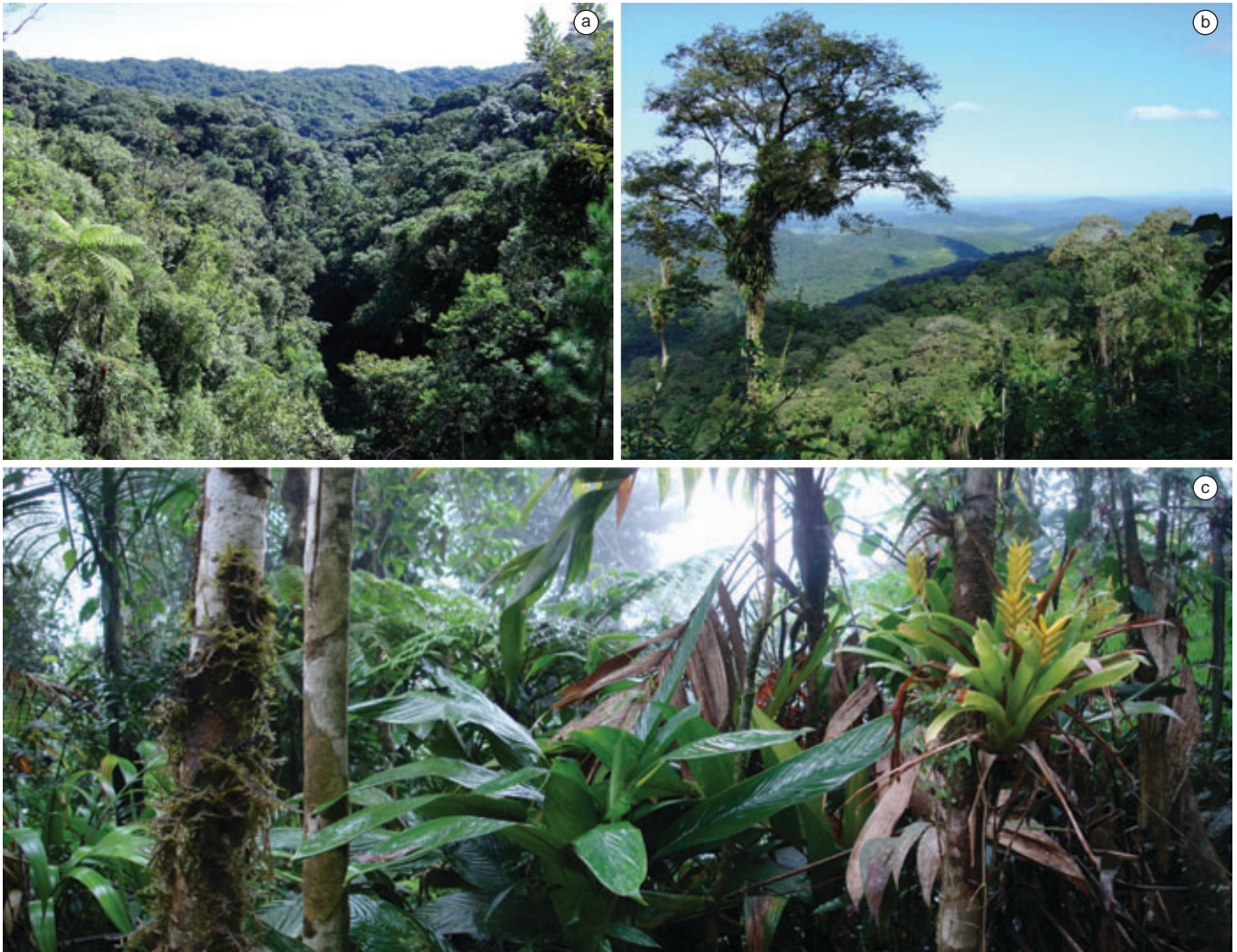
Figura 1. As duas principais fitofisionomias ocorrentes no Parque Estadual Carlos Botelho, São Paulo, Brasil. a) Floresta Ombrófila Densa Montana. b) Floresta Ombrófila Densa Submontana. c) vista interna da Floresta Ombrófila Densa Submontana.

Figure 1. The two main forest types occurring in the Carlos Botelho State Park, São Paulo, Brazil. a) Montane Rain Forest. b) Submontane Rain Forest. c) inside-view of the Submontane Rain Forest.