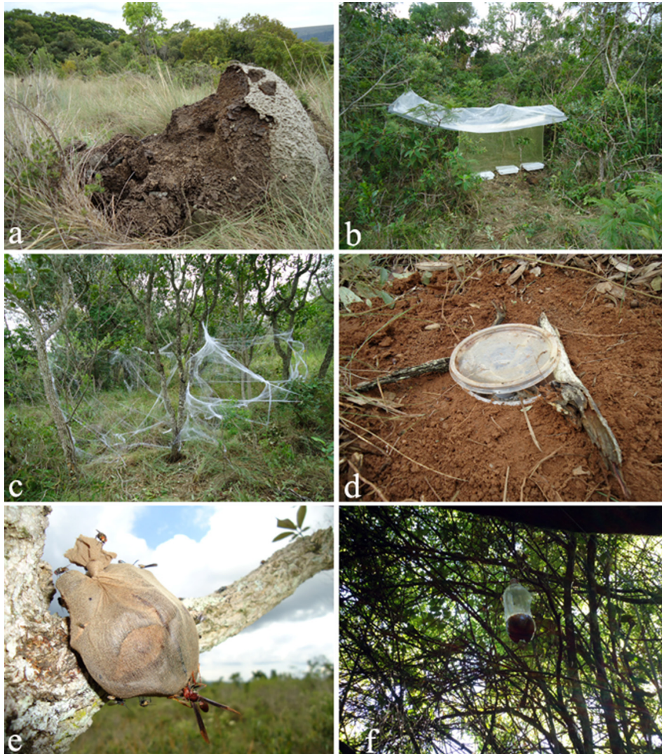
Figura 1. Métodos de coleta de Histeridae. a: Coleta manual em cupinzeiros; b: Armadilha de interceptação de voo; c: Armadilha Cryldé (Teia de aranha artificial); d: Armadilha Pitfall com fezes humana; e: Armadilha com fruta fermentada (meia calça); f: Armadilha com fruta fermentada (garrafa pet ).

Em coletas ativas os histerídeos podem ser encontrados em substratos onde, possivelmente, suas presas (grande maioria dípteros) estejam presentes, como sob casca de árvores em decomposição, no interior de troncos podres, interior de cavidade de árvores, em ninhos de aves, em tocas de répteis ou mamíferos, no interior de